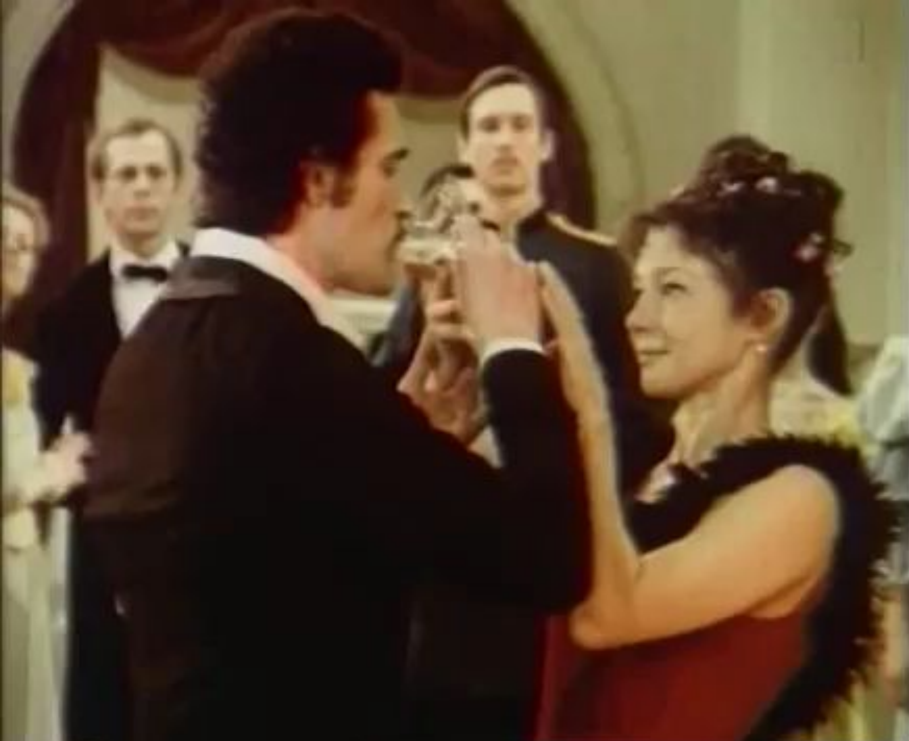
Кадр из фильма-балета – «Тарантелла»