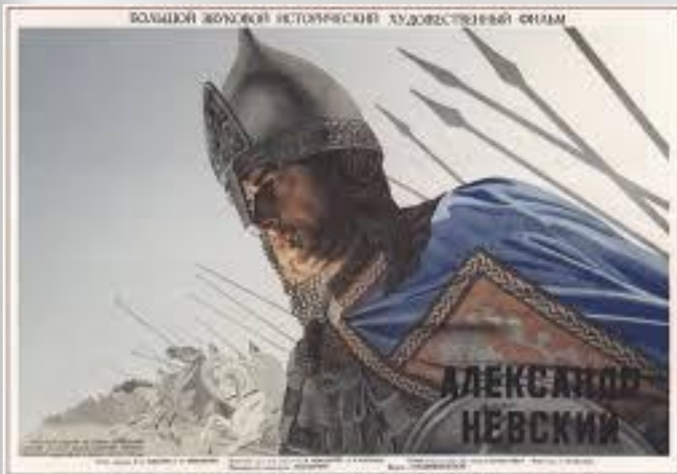
577. Бельский А. Александр Невский. Реж. С. Эйзенштейн. 1938

2 остановка « Кто с мечом к нам придет, тот от меча и погибнет». Воспитанники вспоминали главные сражения А. Невского из материала уроков истории.