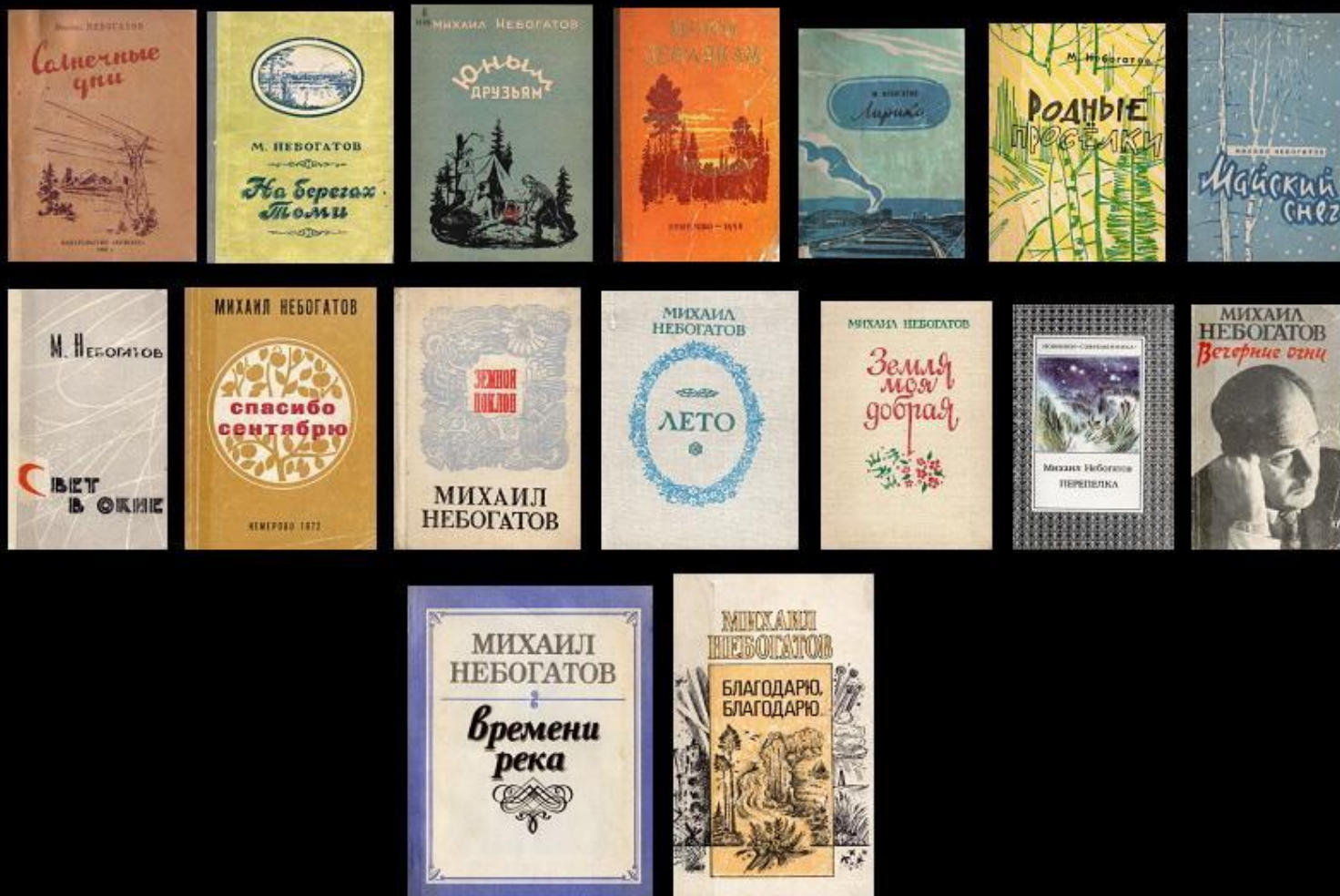
Авторские сборники Михаила Небогатова