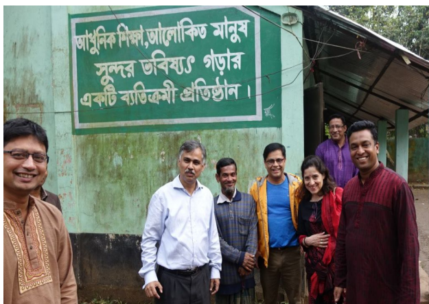
Совместная подготовка программы Школа Мечты