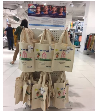
Продажа коллекции футболок и сумок