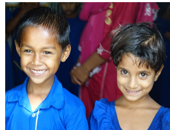
Запуск образовательной программы в школе в Бангладеш