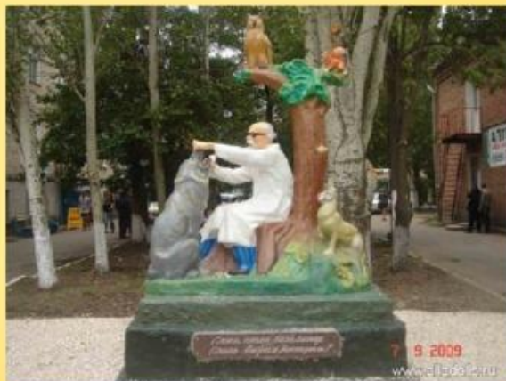
Украина, Бердянск (территория городской больницы)