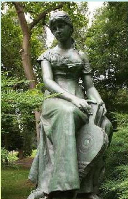
Золушка (Ш. Перро) Брюссель, Бельгия