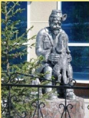
Россия, Тюмень (здание городской ветеринарной клиники)