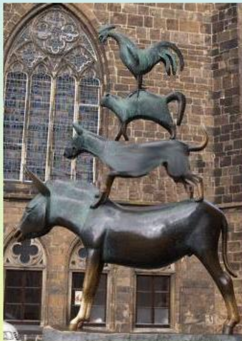
Бременские музыканты (братья Гримм) Бремен, Германия