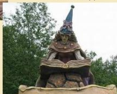
Волшебница Виллина. Подмосковье