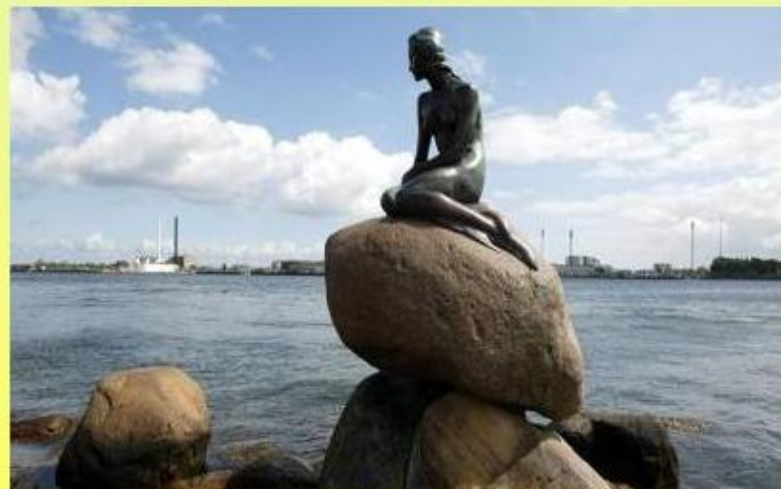
Русалочка (Г.Х.Андерсен) Копенгаген, Дания