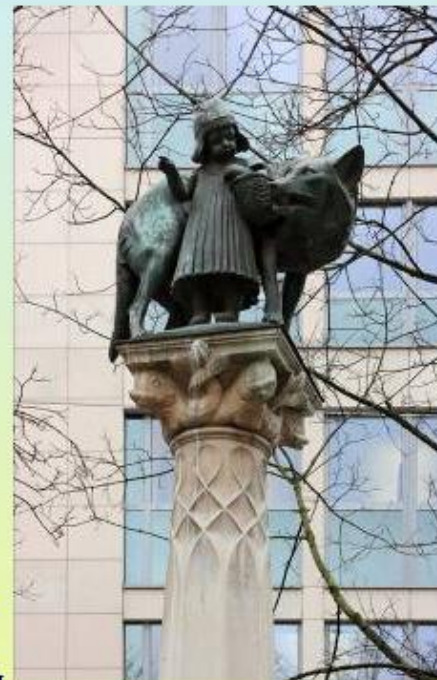
Красная Шапочка (Ш. Перро) Швальм, Германия