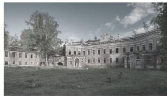
Усадьба Отрада-Семёновское Московская область 1770–1780 гг.

Колонный храм во имя Преображения Господня возвели в 1770-е годы на месте старой деревянной церкви на деньги курских купцов. В XIX веке церковь перестроили расширив один из приделов, изменили колокольню. Главной достопримечательностью храма был старинный колокол весом почти 6,5 тонны. Здание сильно пострадало еще в 1930-е годы, когда советская власть распорядилась закрыть его как религиозное сооружение и переоборудовать в хлебозавод. Колокольня тогда была полностью разобрана. А в 1941 году при отступлении советских войск храм был уничтожен окончательно.