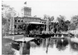
Усадьба Ульянка в Петербурге XVIII век

Усадьба Ульянка была построена в XVIII веке недалеко от Петергофа. Исследователи выдвигают разные версии происхождения этого названия — от князя Чухомца Ульянов до находившегося неподалеку финского села Уула. В разное время усадьба принадлежала разным именитым фамилиям — от Ушаковых до Паниных. В XIX веке ее приобрела семья Шереметевых, для которых архитектор Иероним Корсини построил здесь каменный Шереметевский дворец. В 1941 году здание было полностью разрушено. После окончания войны патристик архитектуры решили не восстанавливать — на его месте построили общеобразовательную школу.