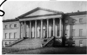
Английский дворец в Петергофе 1781–1796 гг.

При Павле I дворец отдали под казармы, однако при Александре I он был снова восстановлен как императорская резиденция. Впрочем, царская семья в нем не останавливалась — преимущественно во дворце жили иностранные дипломаты, посещавшие Россию. В 1942 году все парковые постройки — многочисленные мостики, павильоны, балustrады и сам Английский дворец — были уничтожены артиллерийским обстрелом.