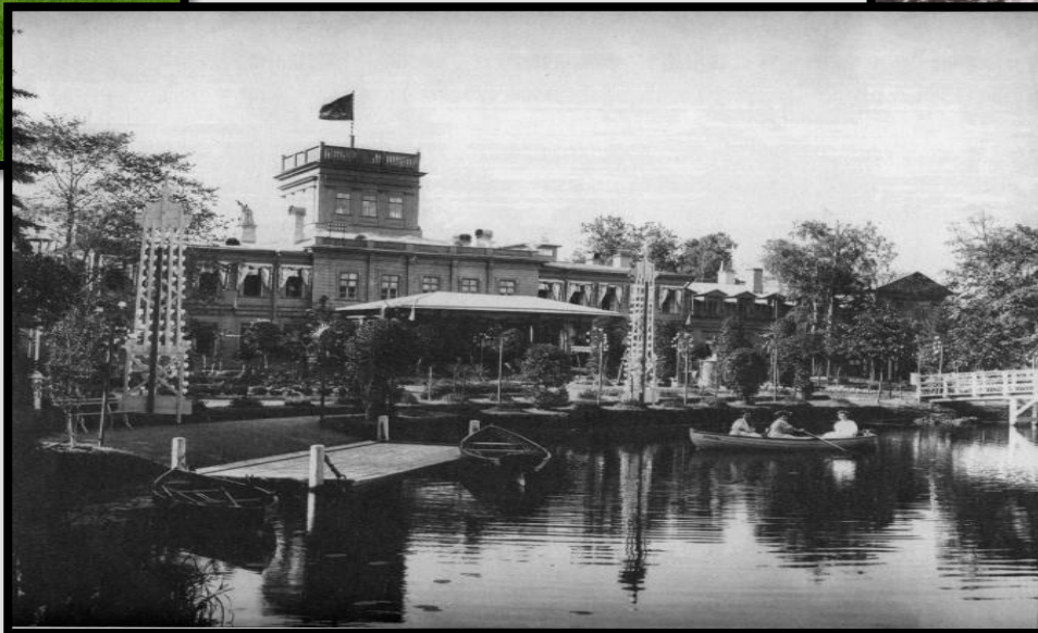
Усадьба Ульянка в Петербурге XVIII век