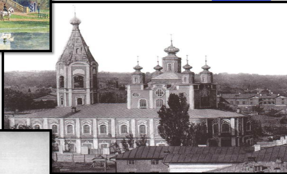
Спасо-Преображенская церковь в Курске 1776-1783 г.г.