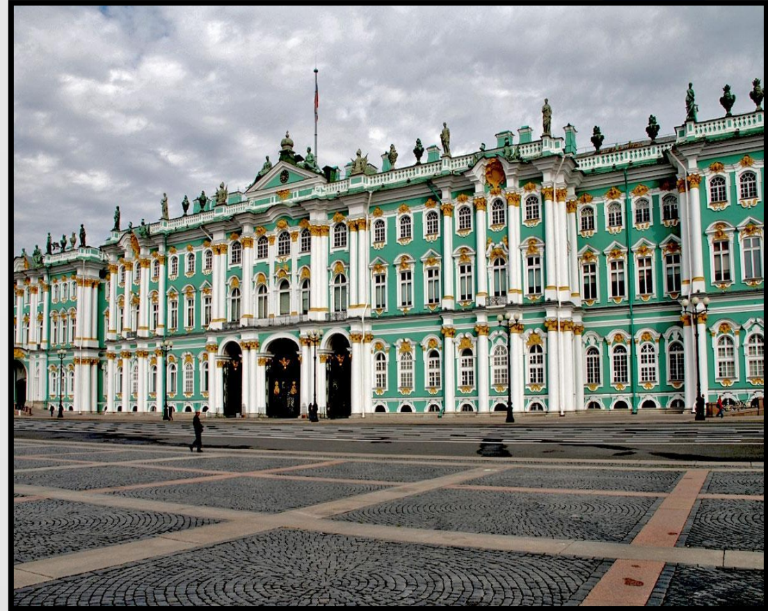
Зимний дворец. Санкт-Петербург 1762 г.

XVIII век длился с 1701 по 1800 год по григорианскому календарю. Этот век прославился грандиозными переменами, произошедшими, благодаря реформам Петра Первого. Большие изменения произошли и в русской культуре XVIII века. Она европеизировалась, приобретала светский характер, включалась в процесс взаимодействия с культурами других стран. В XVIII веке начинается развиваться русская архитектура. Главная задача архитектуры: проектировать и строить