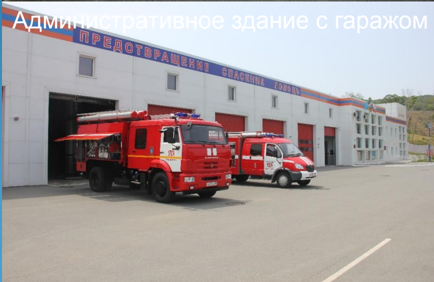
Административное здание с гаражом