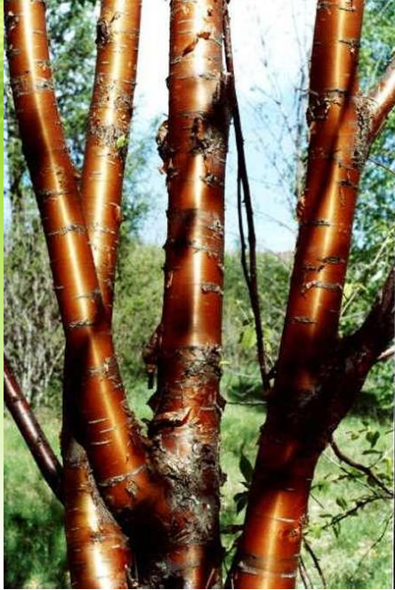
Черёмух а Маака