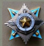
Орден «За службу Родине в Вооружённых Силах СССР» III степени