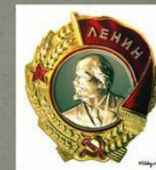
Ордена Ленина (два) И другие награды