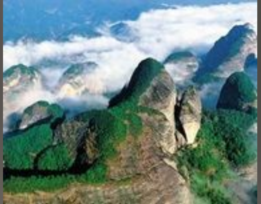
Гора Лан в провинции Хунань