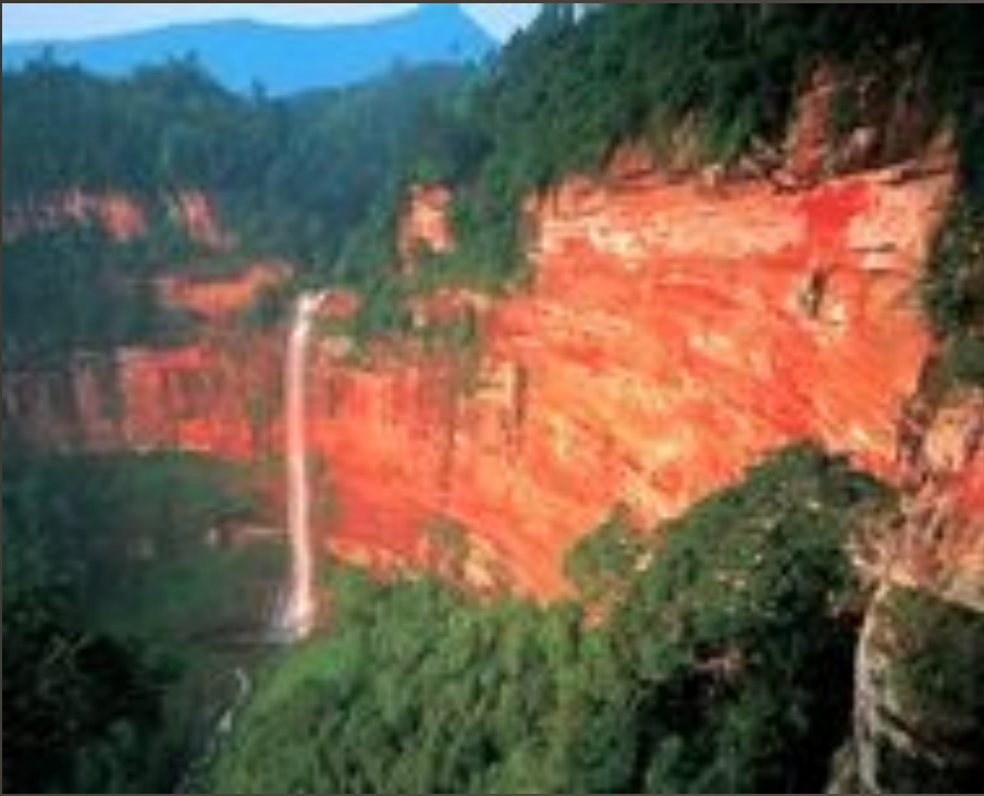
Чишуй Данься в провинции Гуйчжоу