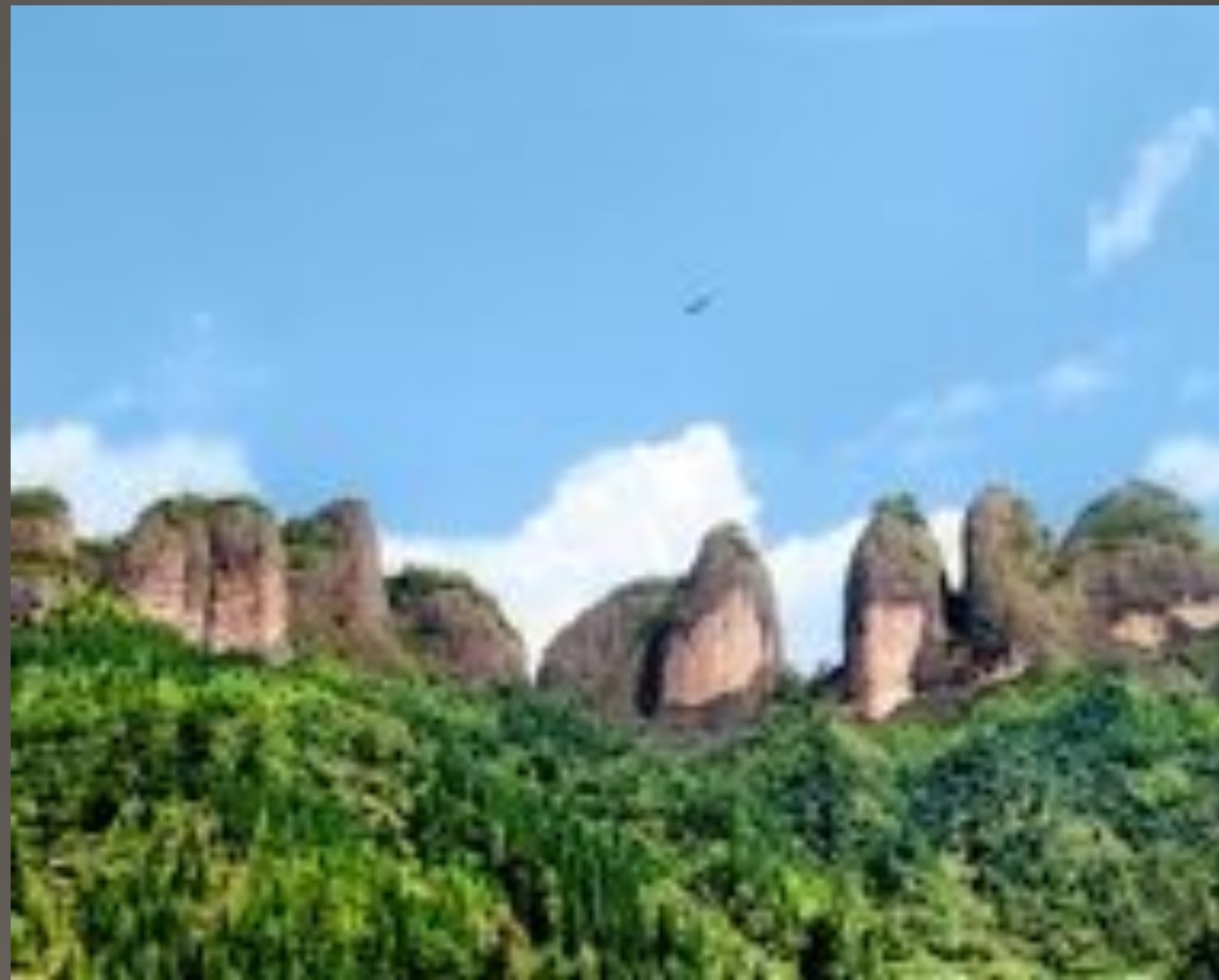
Тайнин Данься в провинции Фуцзянь