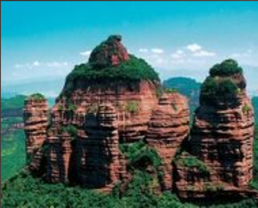
Гора Данься в провинции Гуандун