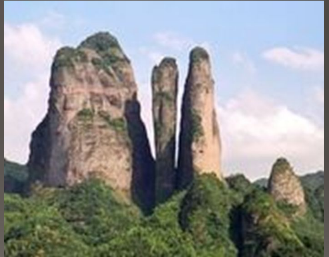
Гора Цзянлан в провинции Чжэцзяне