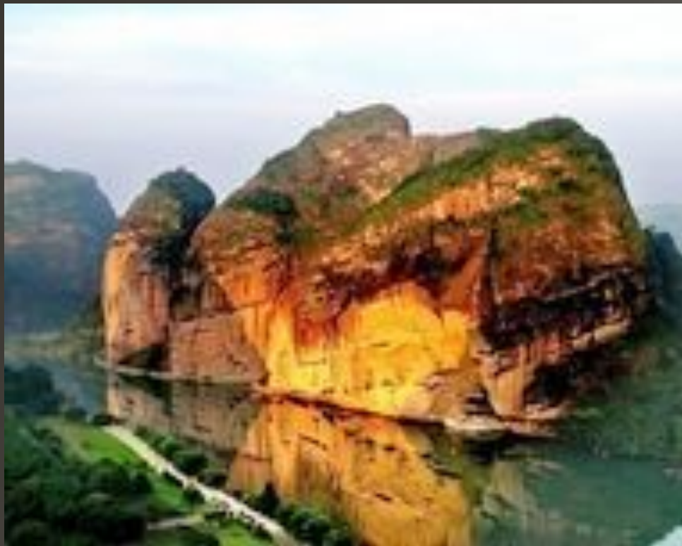
Гора Лонху в провинции Цзянси