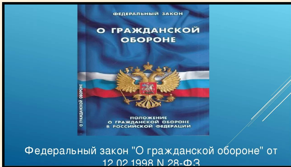
Федеральный закон "О гражданской обороне" от 12 02 1998 N 28-ФЗ

Федеральный Закон «О гражданской обороне» определяет задачи в области гражданской обороны и правовые основы их осуществления.