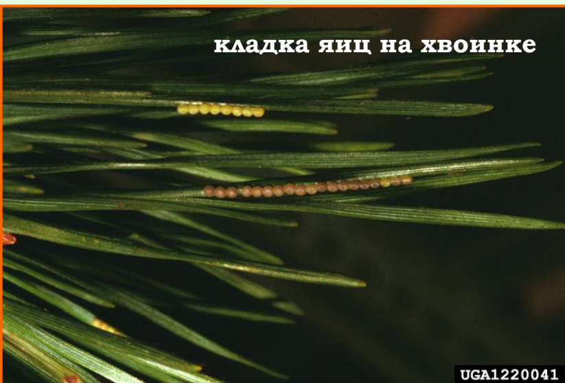
кладка яиц на хвоинке