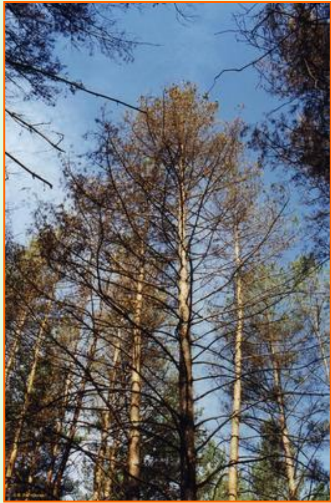
Сосны, поврежденные гусеницами шелкопряда монашенки