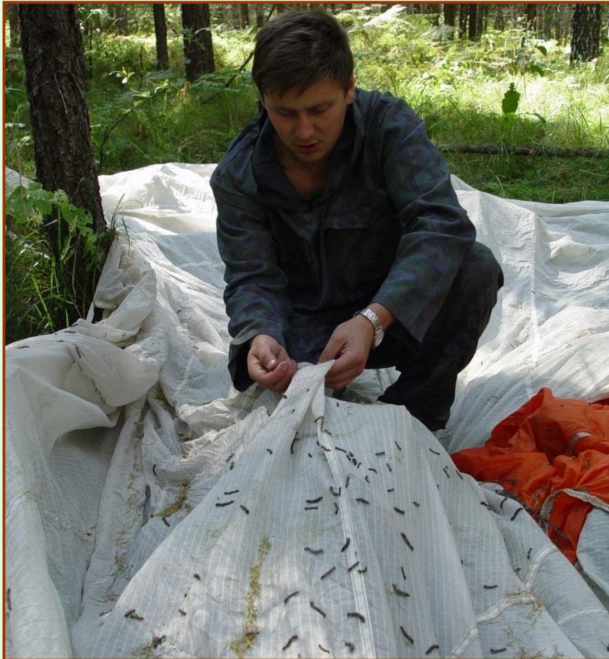
Учёт численности гусениц