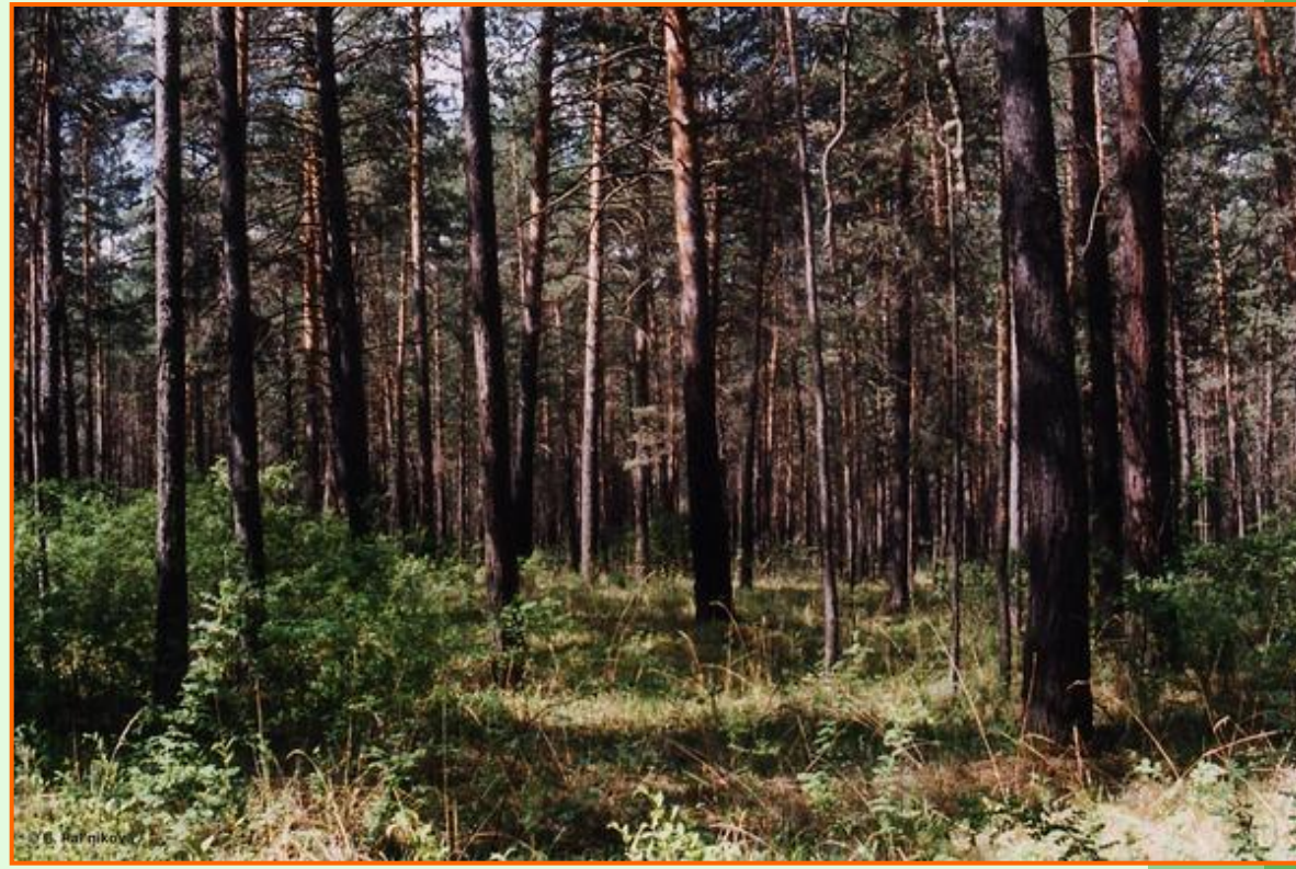
Участок соснового леса, где может сформироваться очаг шелкопряда монашенки