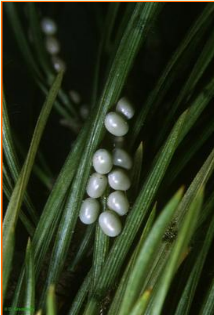
кладка яиц на хвое сосны