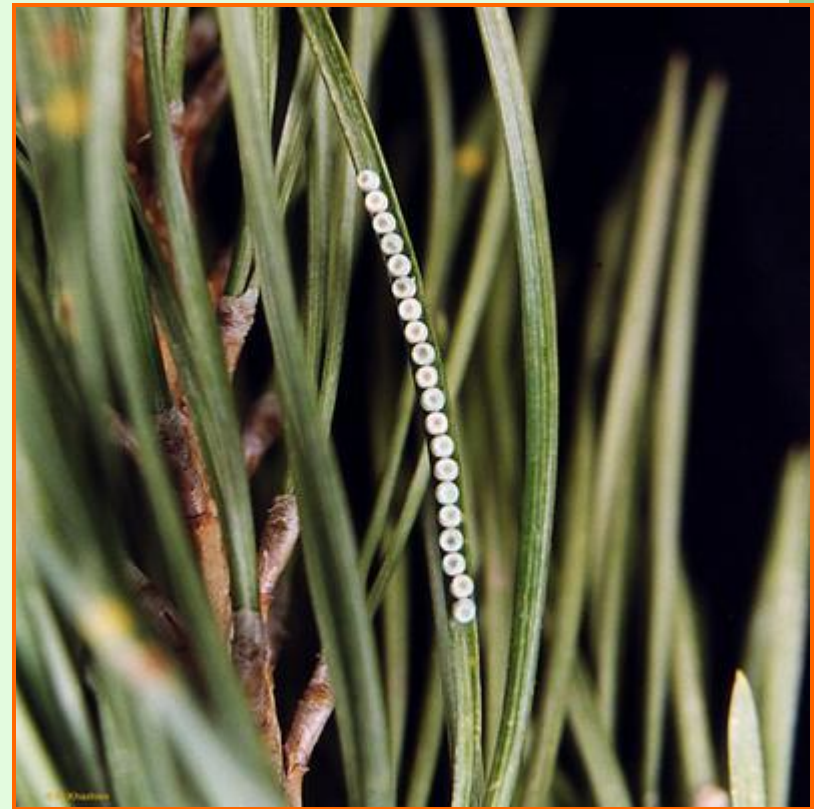
кладка яиц на хвоинке сосны