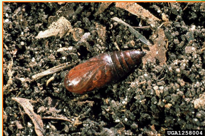
куколка на зимовке