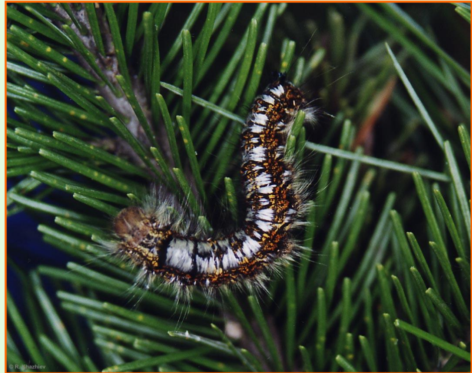
Гусеницы III-IV возраста