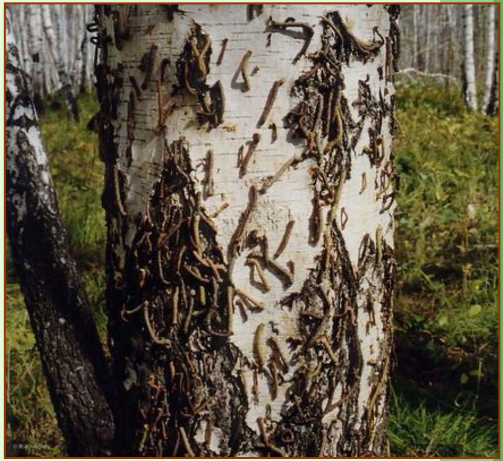
Гусеницы поднимающиеся по стволу

Берёзовое насаждение полностью объеденное пяденицей