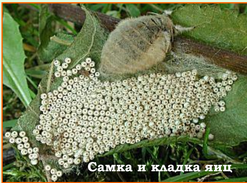
Самка и кладка яиц