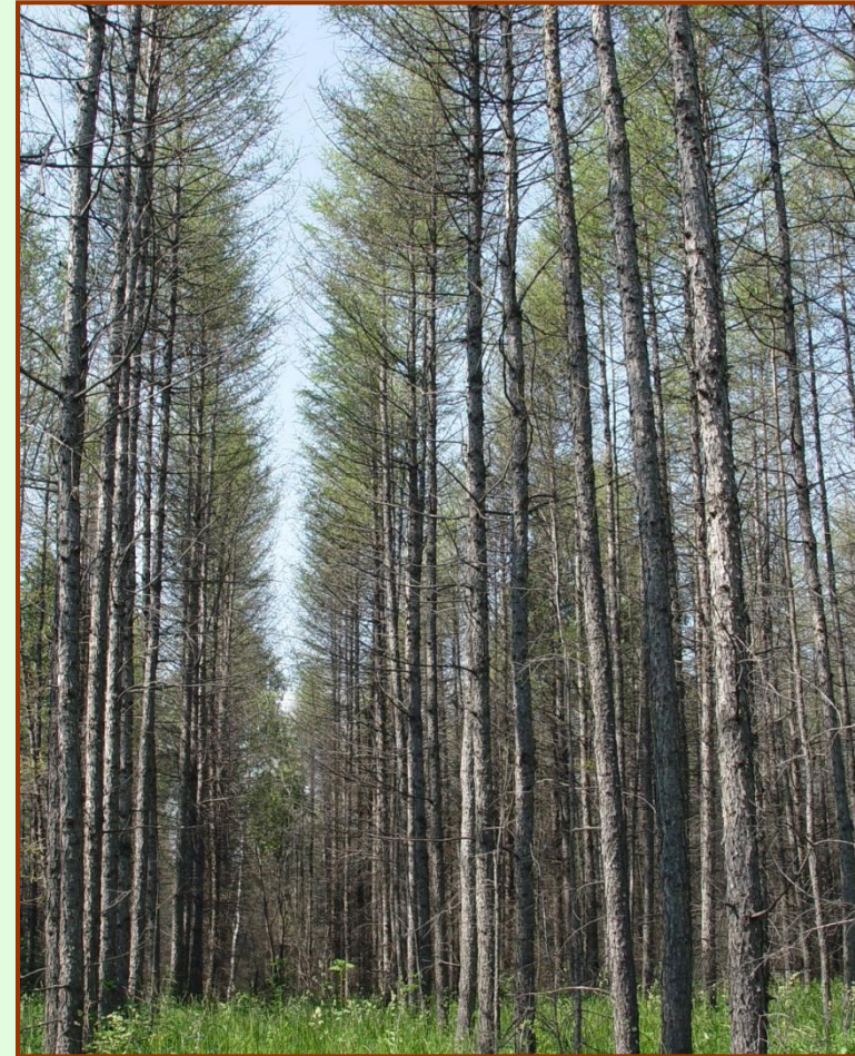
Объединенные лесные культуры лиственницы