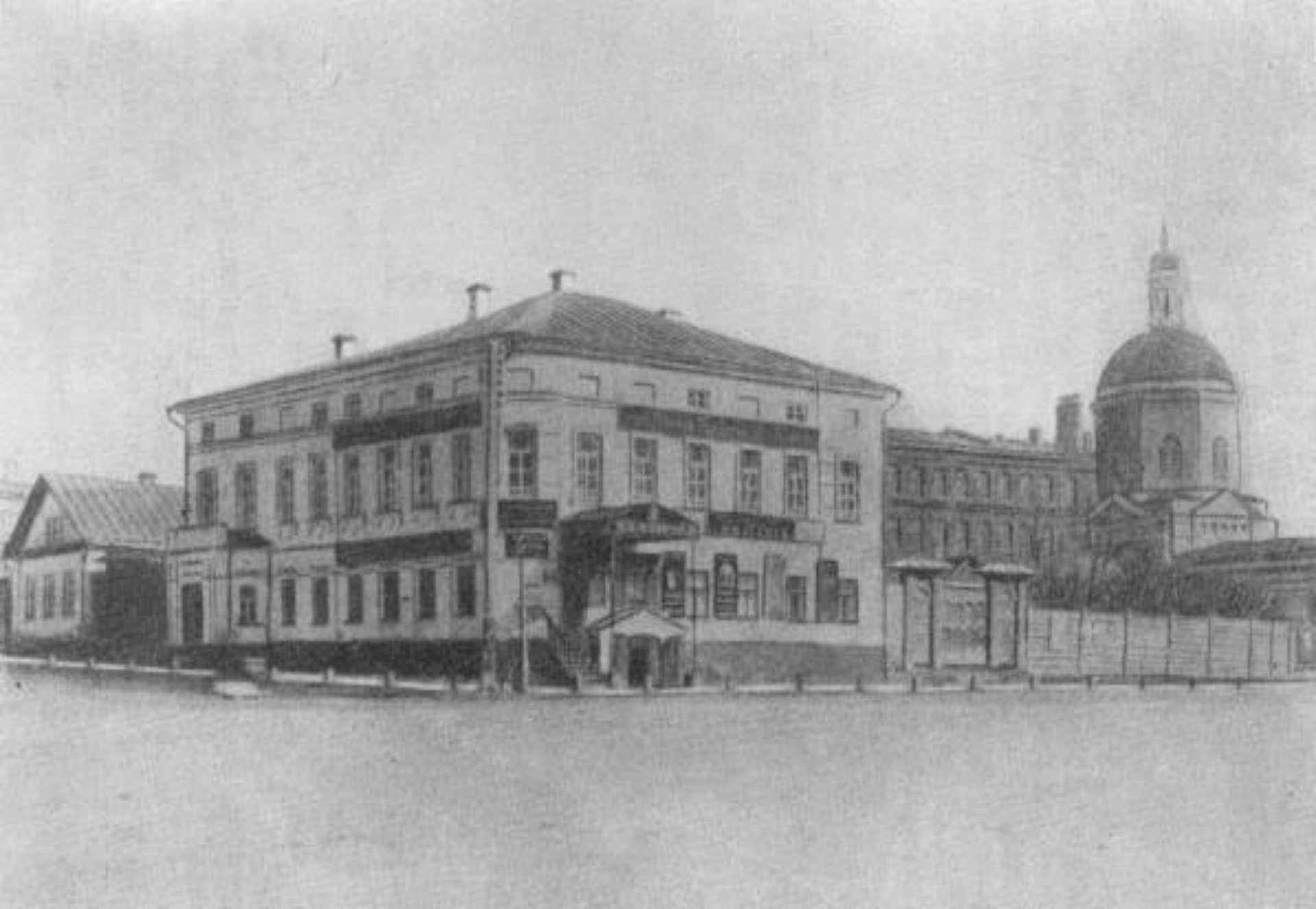
Дом в Симбирске, в котором родился И. А. Гончаров.