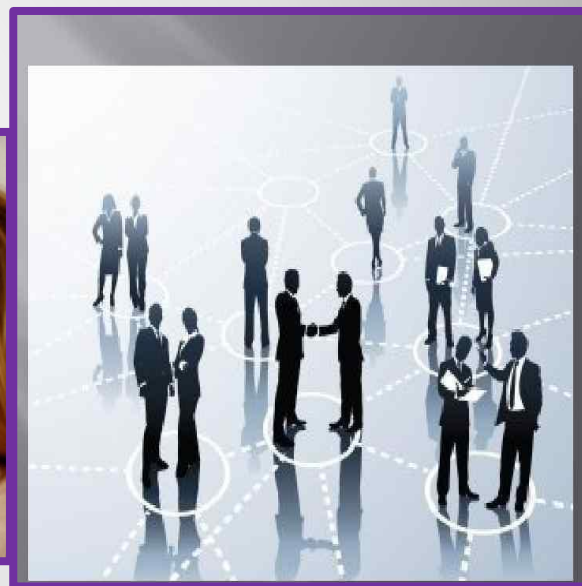
Пространственную организацию общения