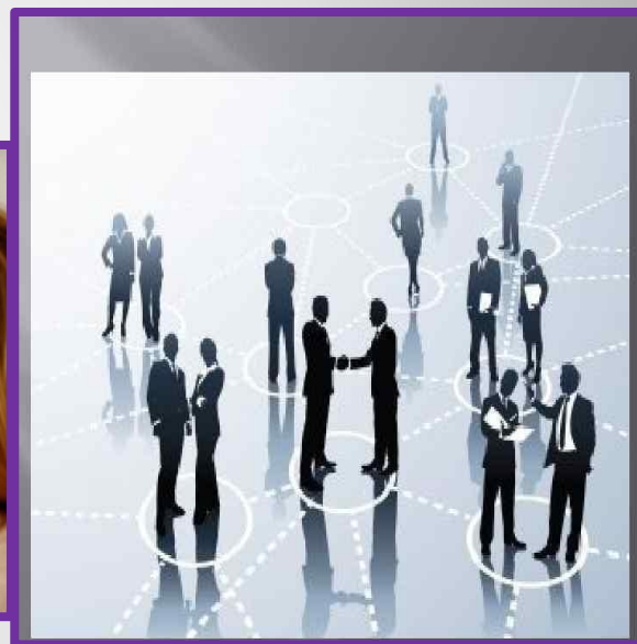
Пространственную организацию общения