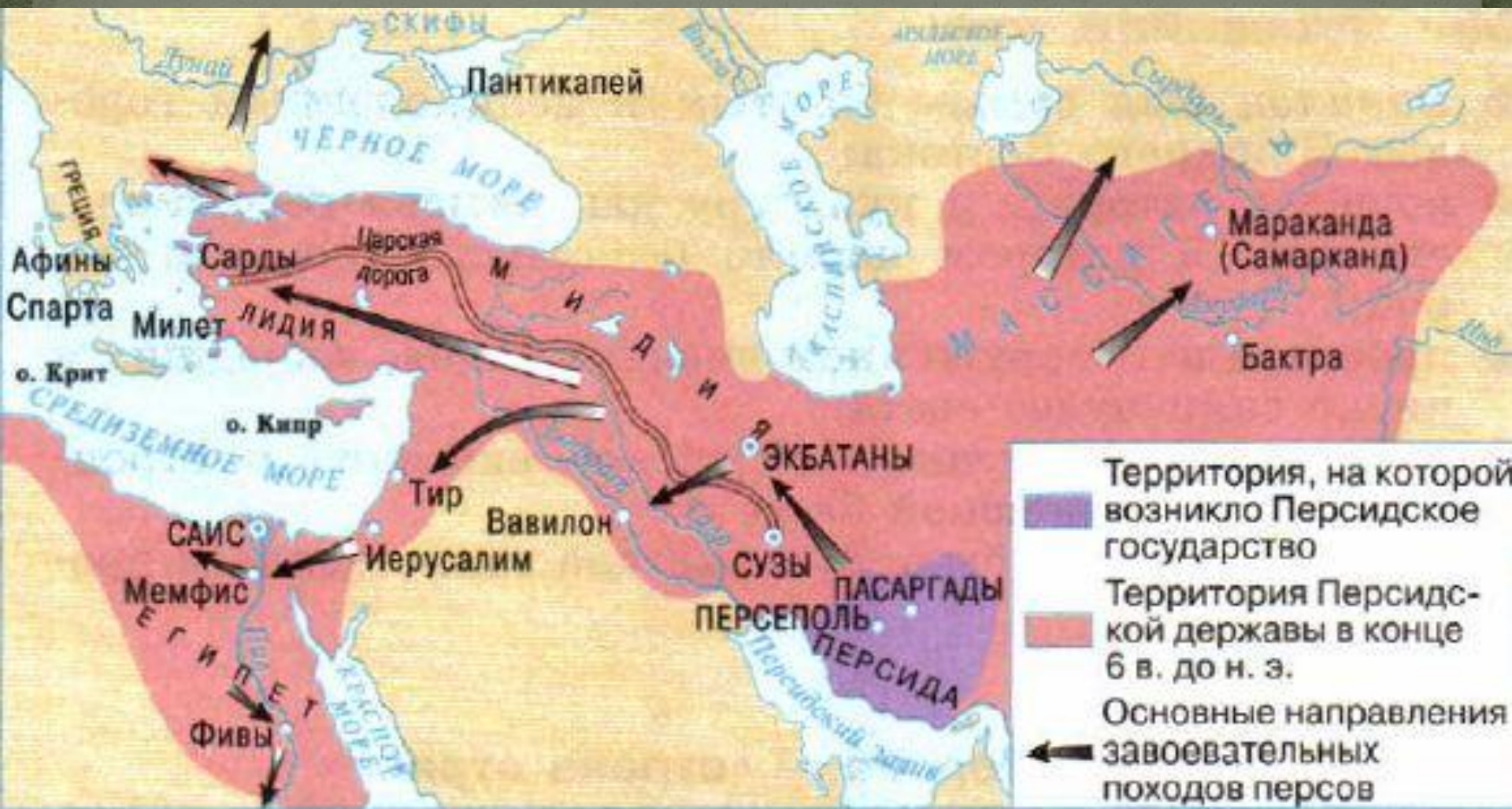
Персидская держава в 6 веке до н. э.