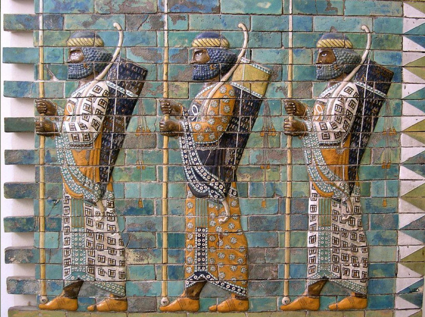
«Бессмертные» (VI в. до н. э.)