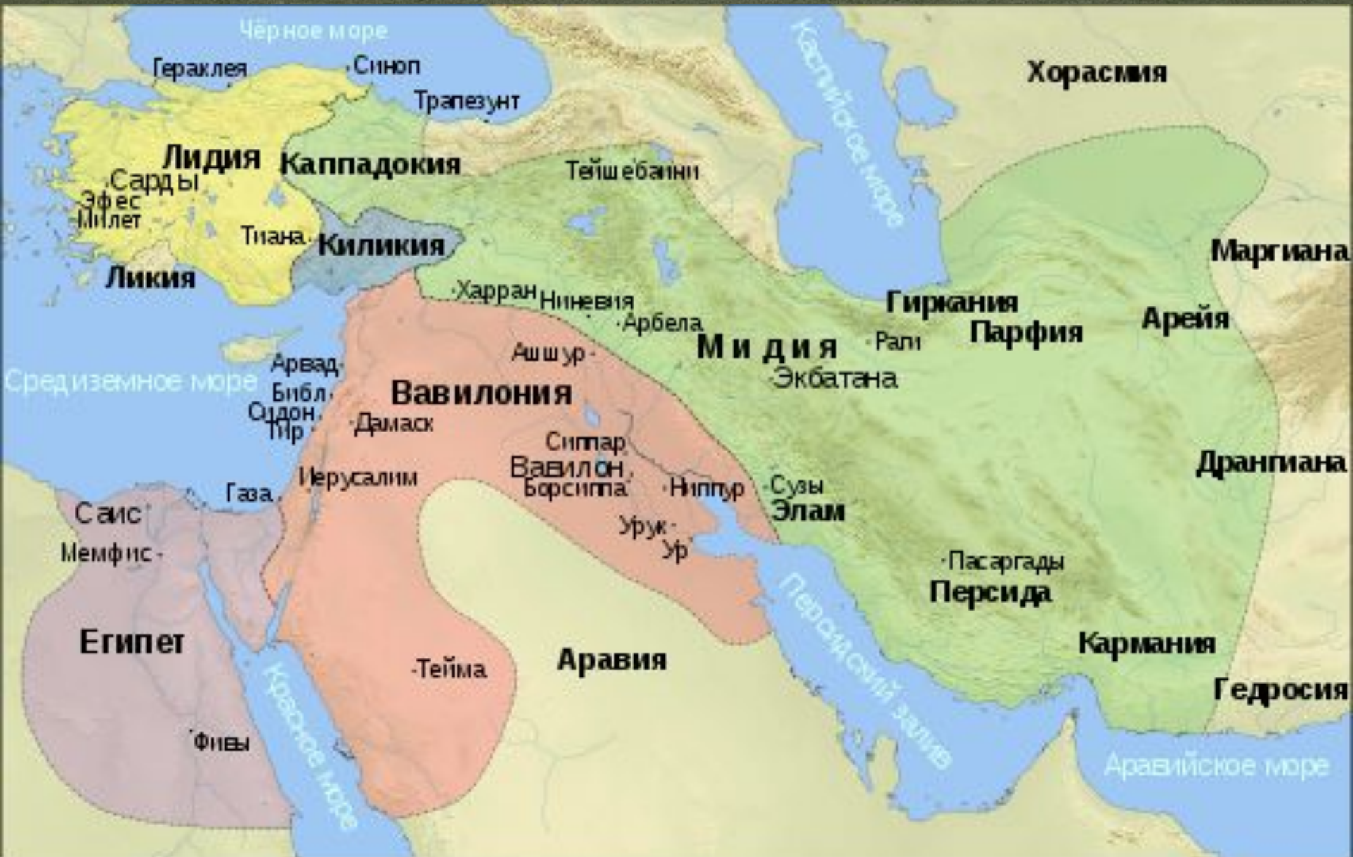
Ближний Восток в сер. VI в. до н. э.