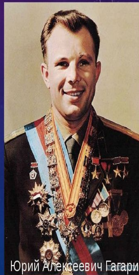
Юрий Алексеевич Гагарин