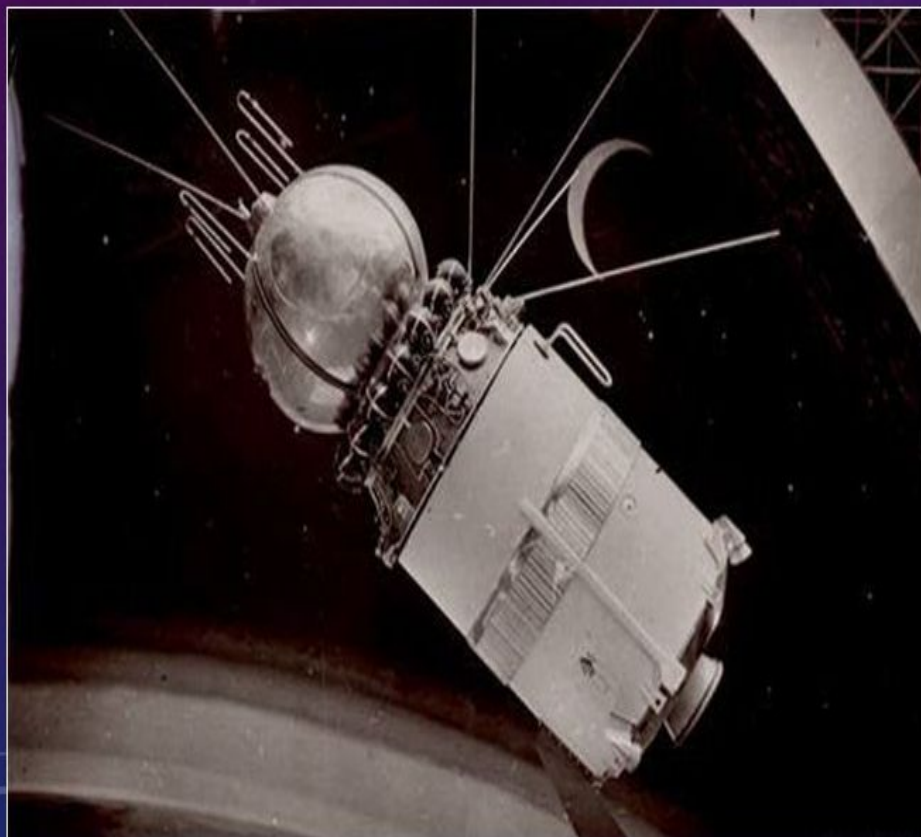
Космический корабль «Восток»