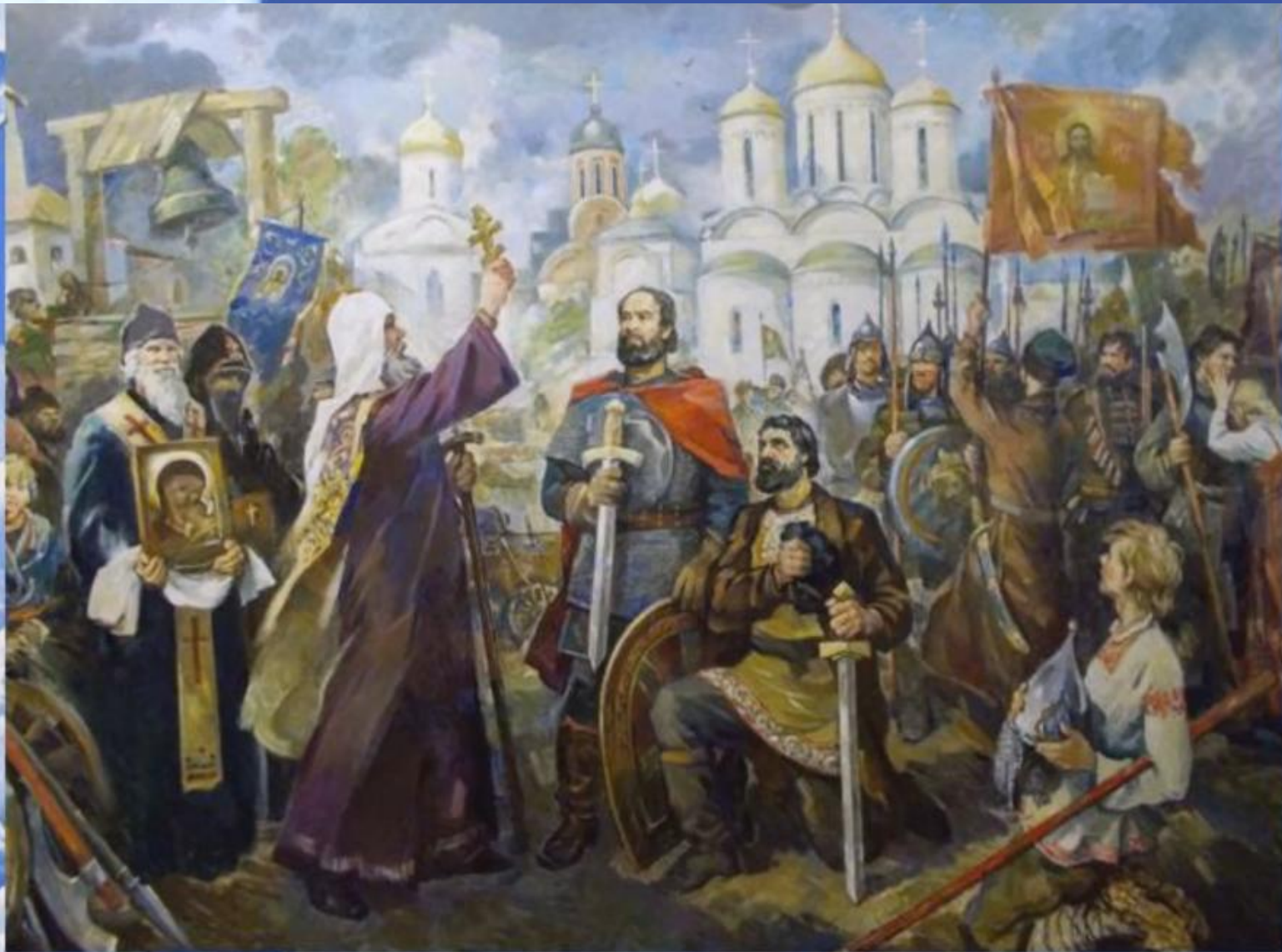
Народное ополчение 1612 года