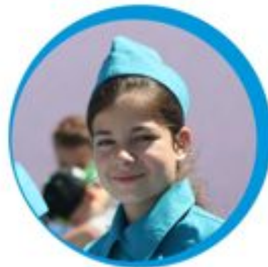
Юные инспекторы движения