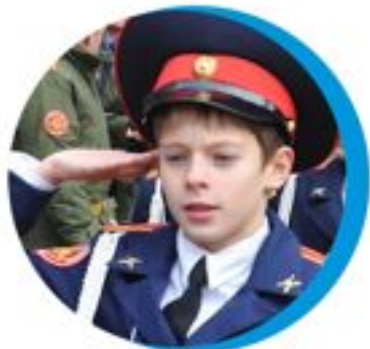
Юные помощники полиции