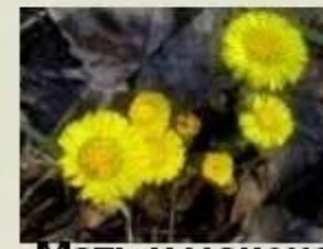
Мать и мачеха