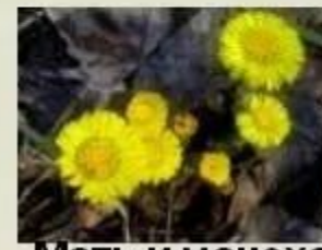
Мать и мачеха