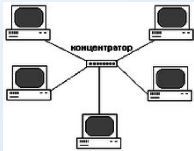
Рисунок 1.1 «Схема сети»