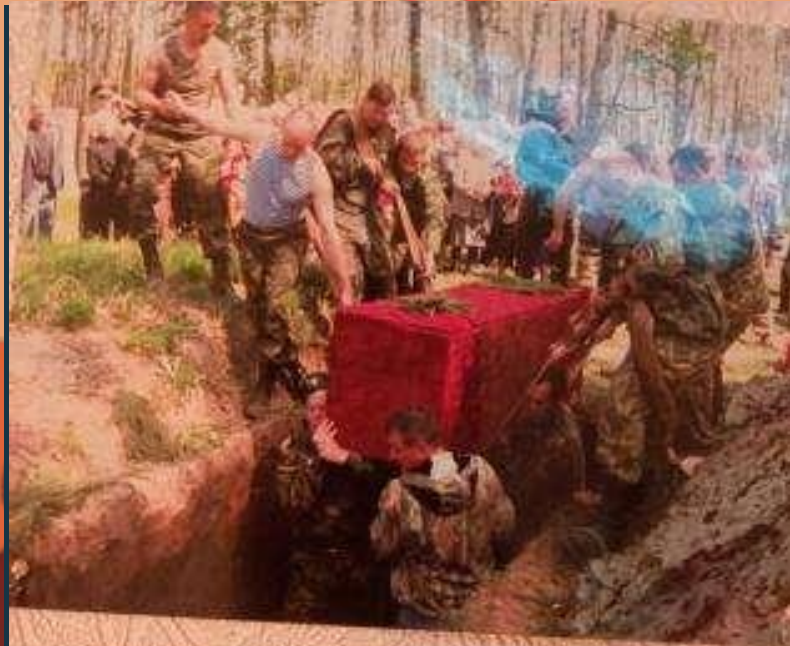
Захоронение на Кривцовском мемориальном кладбище. 2009г.

За 10 лет поисковыми отрядами и объединениями с разных регионов страны, в том числе из Курганской области, только в нескольких районах Орловской области были подняты и перезахоронены 2269 советских бойцов . Ежегодно наш поисковый отряд «Звезда», в канун Дня Победы, несет Вахту Памяти на местах экспедиций.