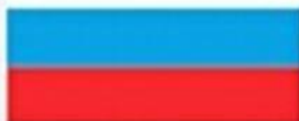
Государственный флаг России