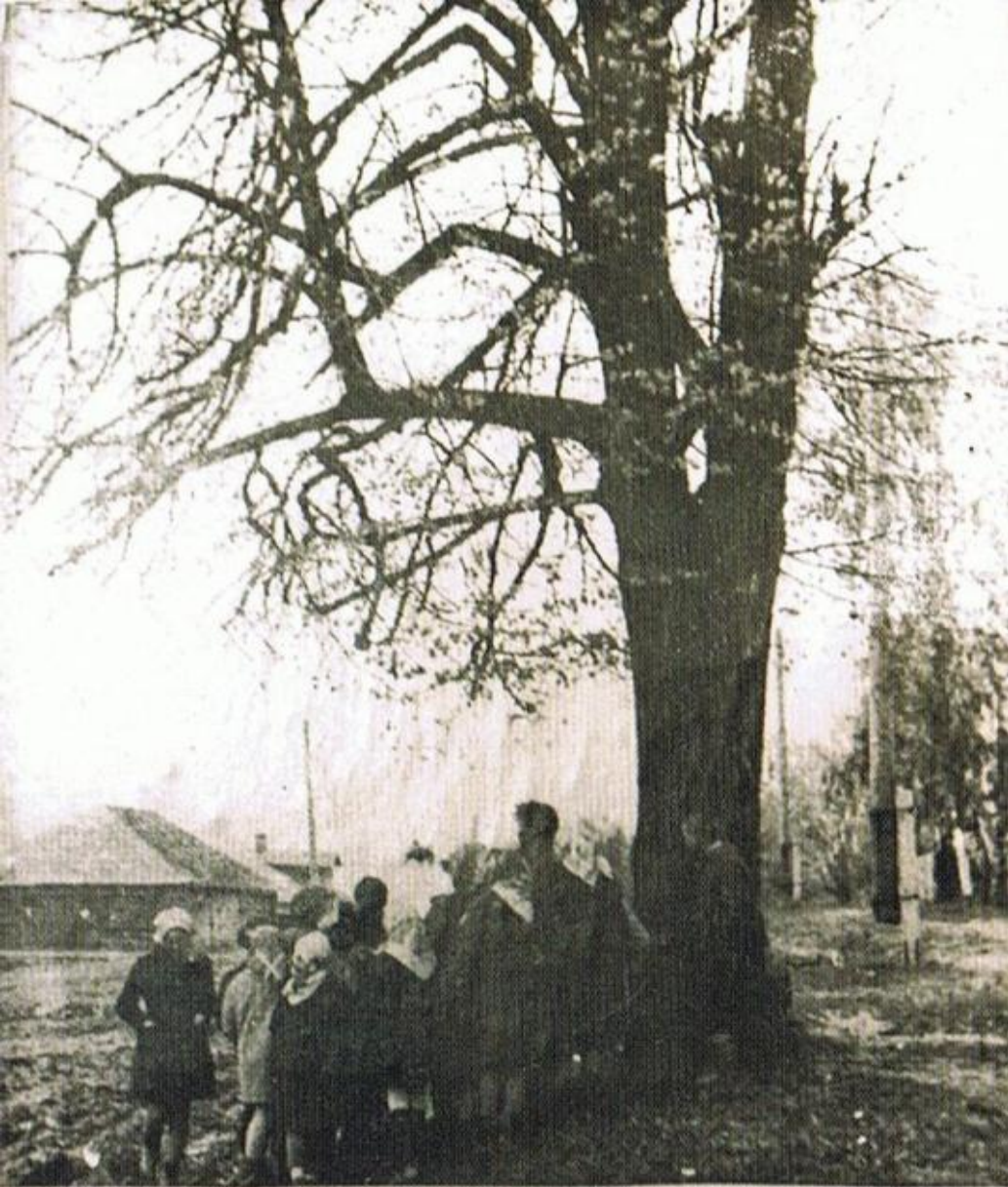
Липа-свидетельница фашистского злодеяния.