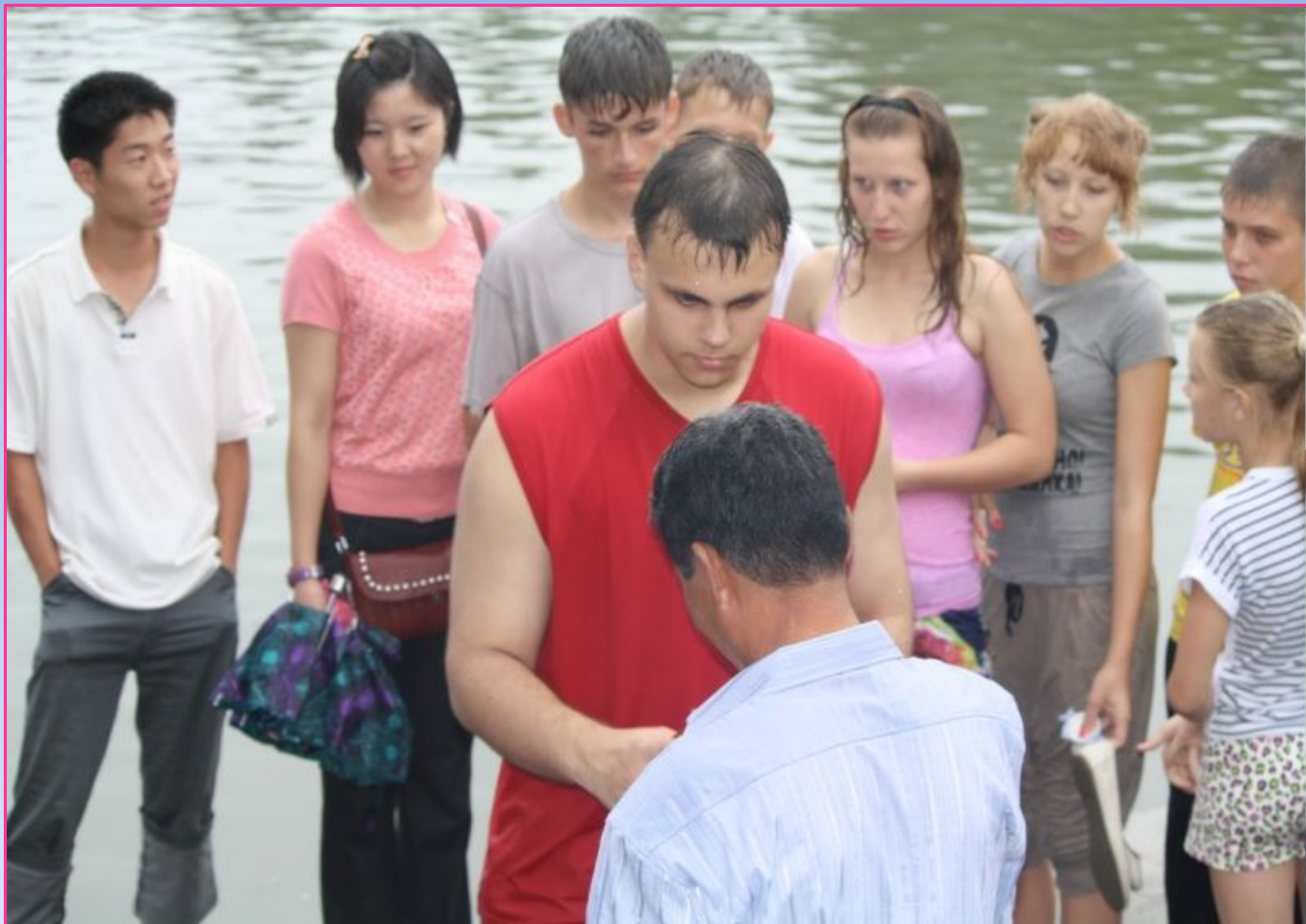
«Благодарность руководства международного лагеря Северной Кореи за спасение утопающих».