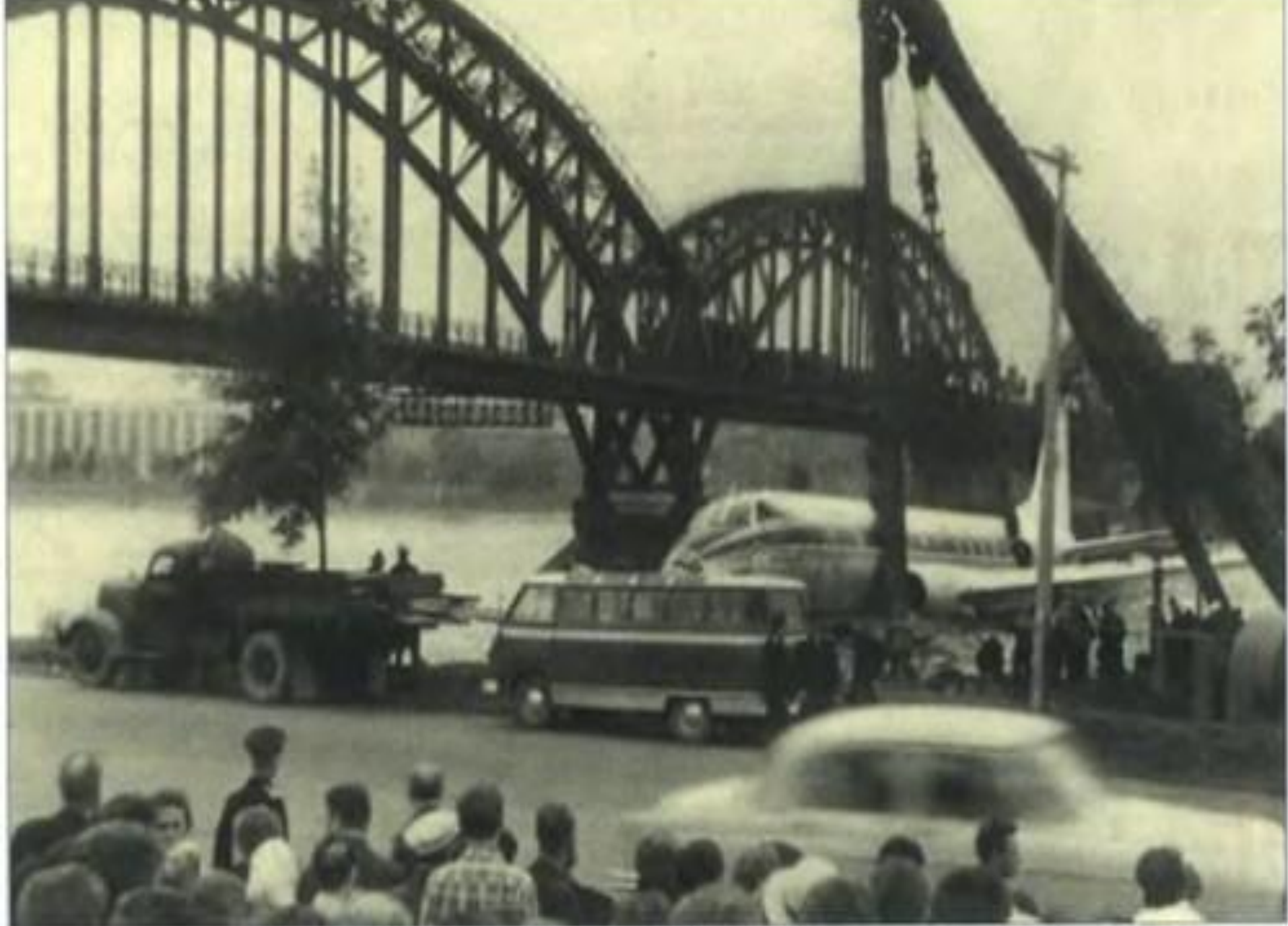
Ту-124 на Малоохтинской набережной у Фшляндского моста в Ленинграде. Август 1963.