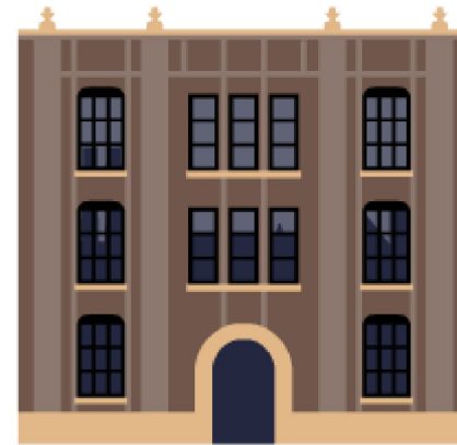
Нижняя палата – Государственная Дума