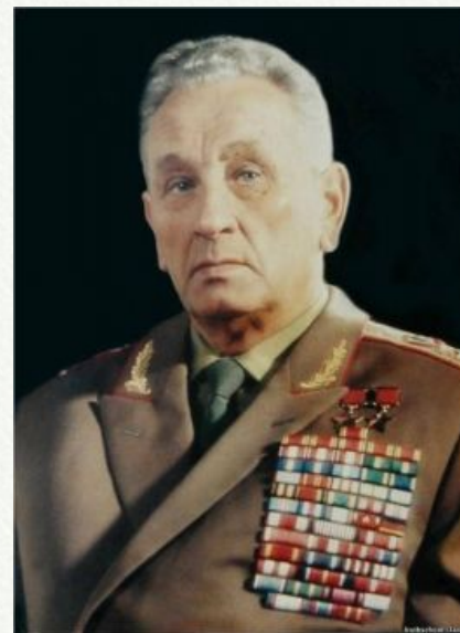
Гречко Андрей Антонович генерал-полковник.

Командующими были: Кузнецов В. И. (декабрь 1942 - декабрь 1943), генерал-лейтенант, с конца мая 1943 генерал-полковник Гречко А. А. (декабрь 1943 - май 1945), генерал-полковник. Эта армия в период Великой Отечественной войны против немецко-фашистских захватчиков прошла большой и славный путь от Сталинграда через Донбасс до Праги. Дон, Днепр, Днестр, Западная Украина, Карпаты, Польша, Чехословакия – таковы главные вехи боевого пути армии. В это время командовал первой гвардейской армией генерал-лейтенант Кузнецов Василий Иванович.