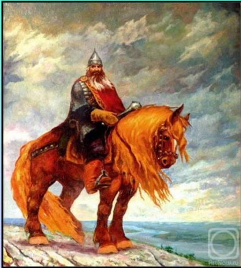
Святогор - богатырь. Николай Бульчев.

Выяснив, кто такие богатыри , постараемся ответить на вопрос, какие они?