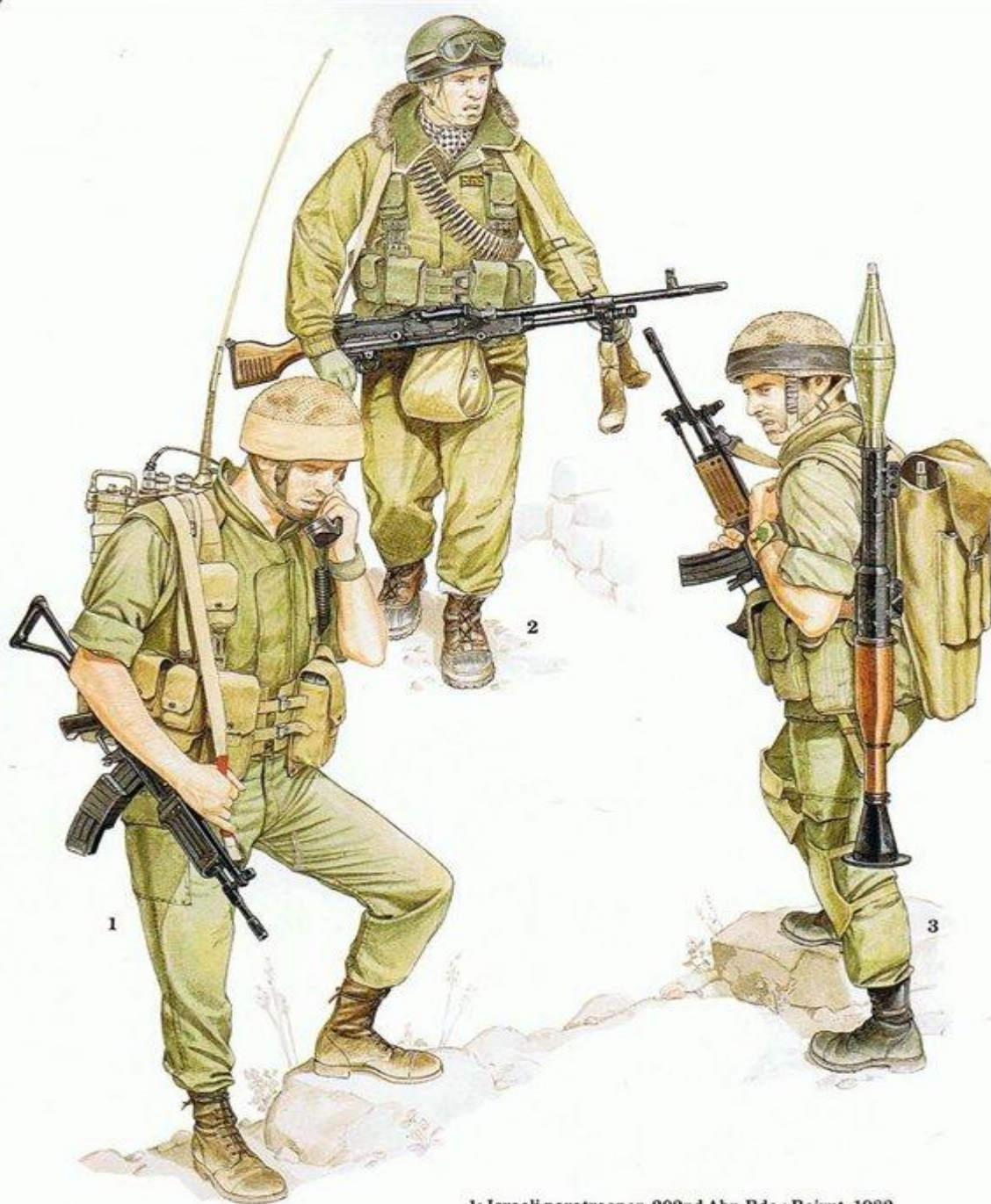
1: Israeli paratrooper, 202nd Abn. Bde.; Beirut, 1982 2: Israeli paratrooper 'MAGist'; Shouf Mts., Feb. 1983 3: Israeli infantryman, Golani Bde.; S. Lebanon, June 1982