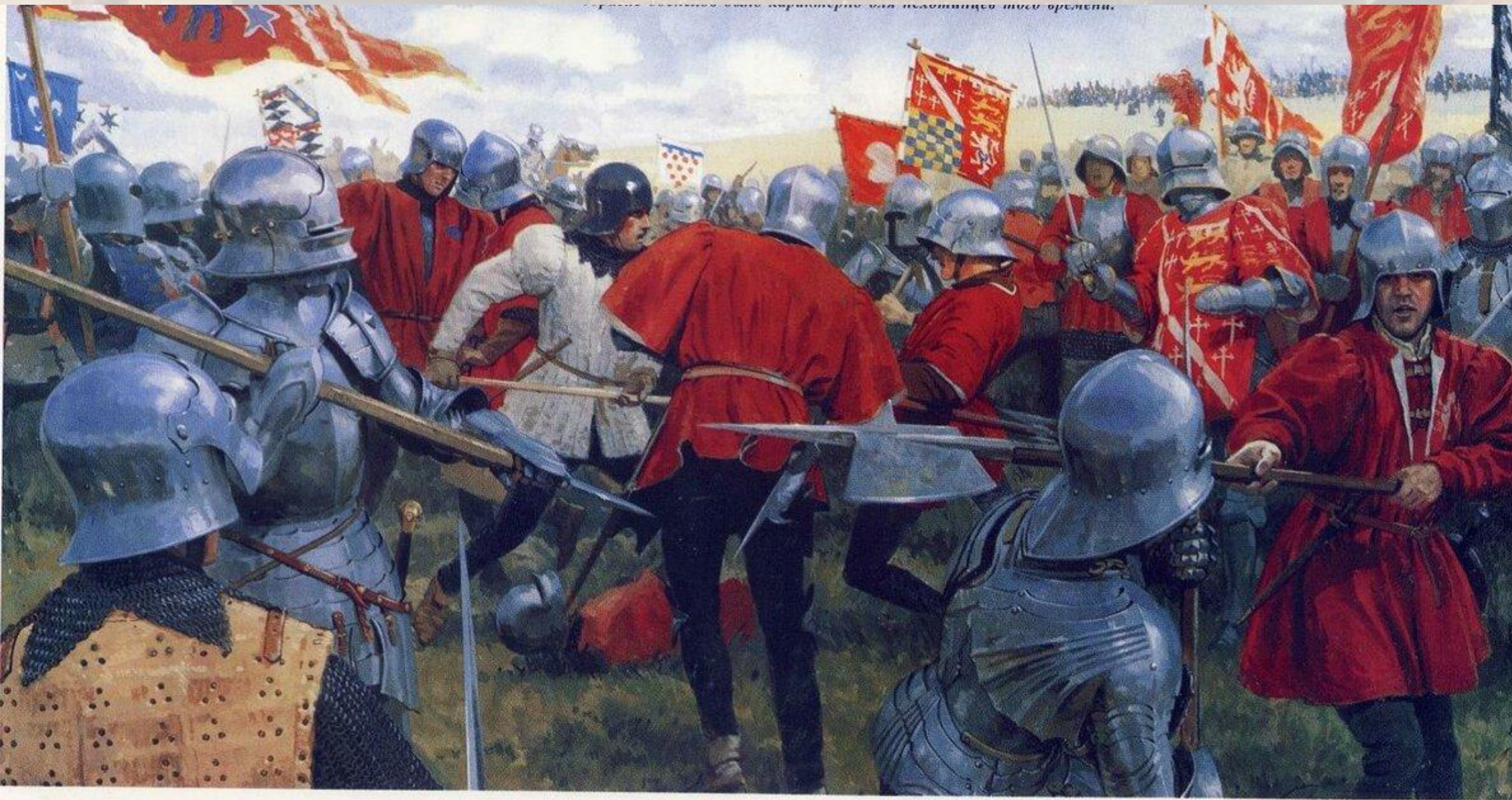
Рис. 1. Битва при Курцихове с полчищем тюркских ордын.