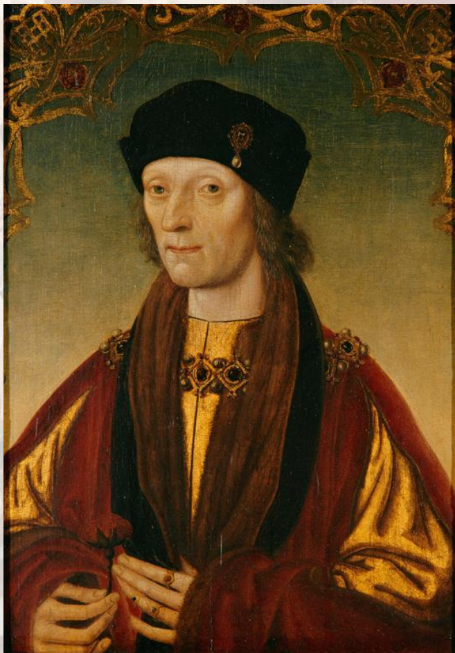
Как я выгляжу