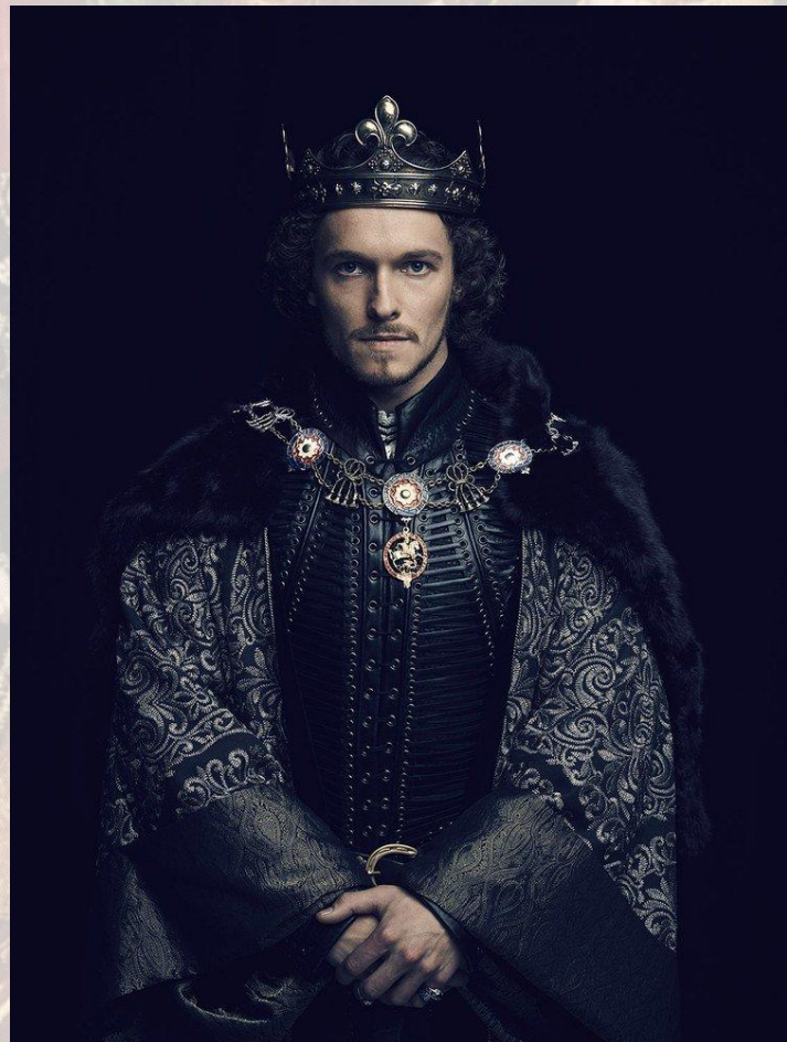
Как я выгляжу в рассказах мамы