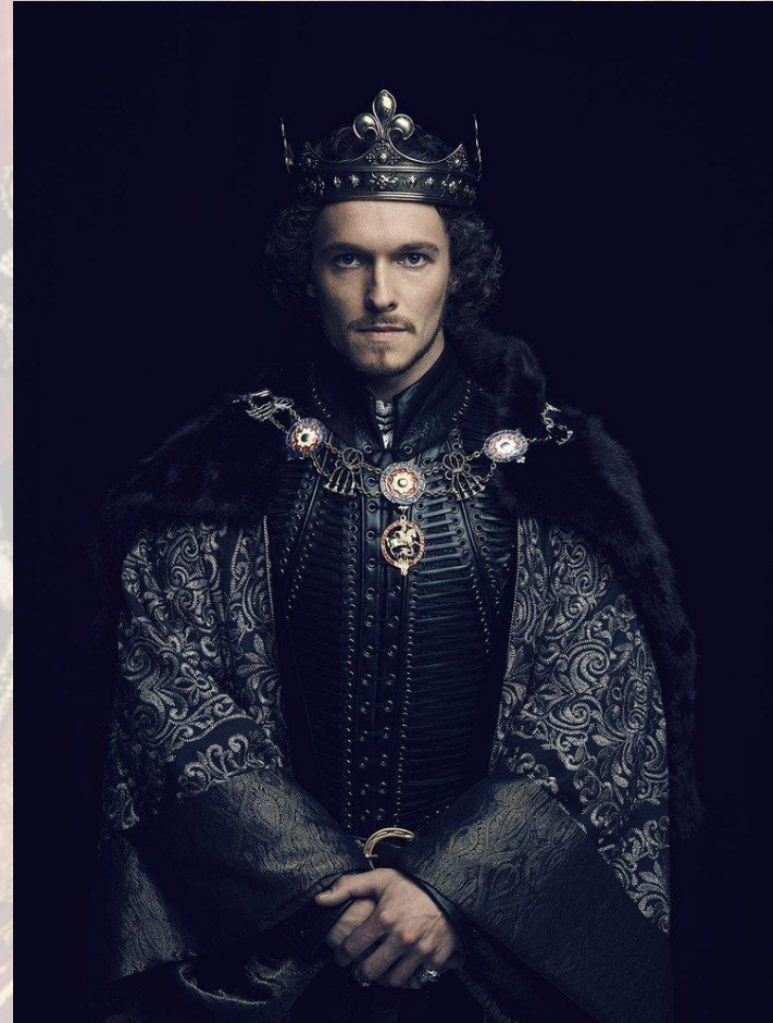
Как я выгляжу в рассказах мамы