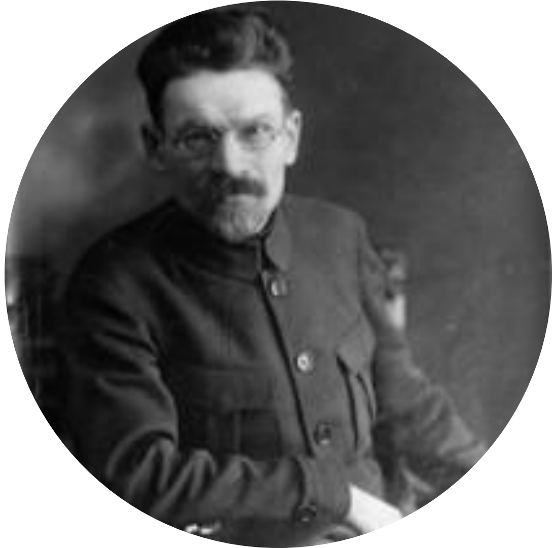
Михаил Иванович Калинин