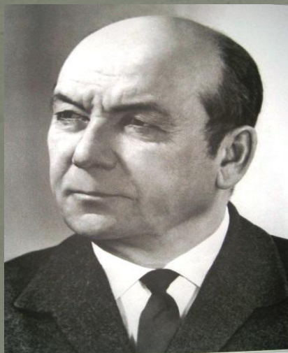
ГОМӘР БӘШИРОВ (1901–1999)