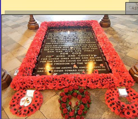
Англия Вестминстерское аббатство

В декабре 1966 г., в канун 25-летия битвы под Москвой, к Кремлёвской стене был перенесён прах неизвестного солдата из захоронения у 41-го километра Ленинградского шоссе. На плите, лежащей на могиле Неизвестного солдата, сделана надпись: «Имя твоё неизвестно. Подвиг твой бессмертен» (автор слов — поэт С.В. Михалков).