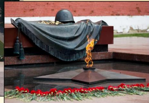
Россия, Москва Могила неизвестного солдата