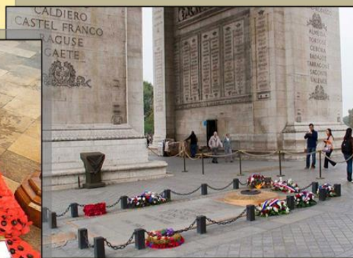
Париж Триумфальная арка