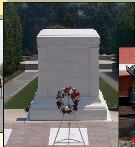
США Арлингтонское кладбище