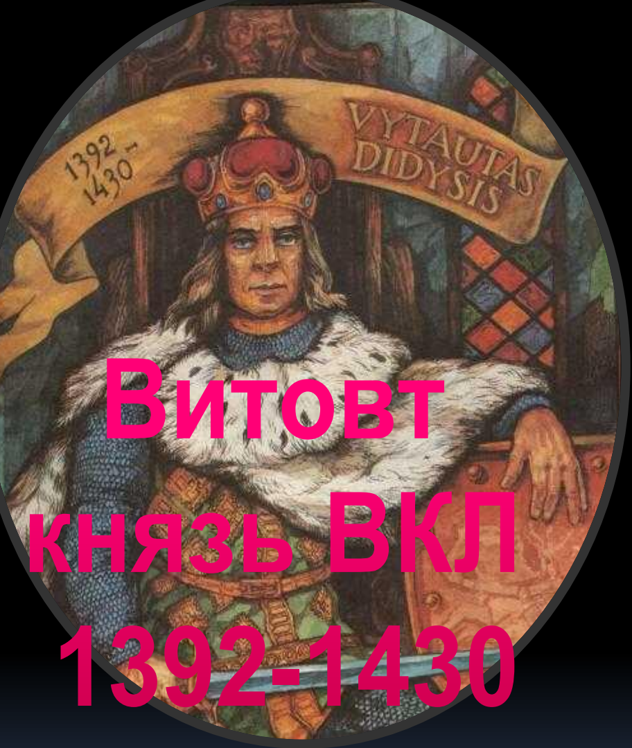
ВИТОВТ КНЯЗЬ ВКЛ 1392-1430