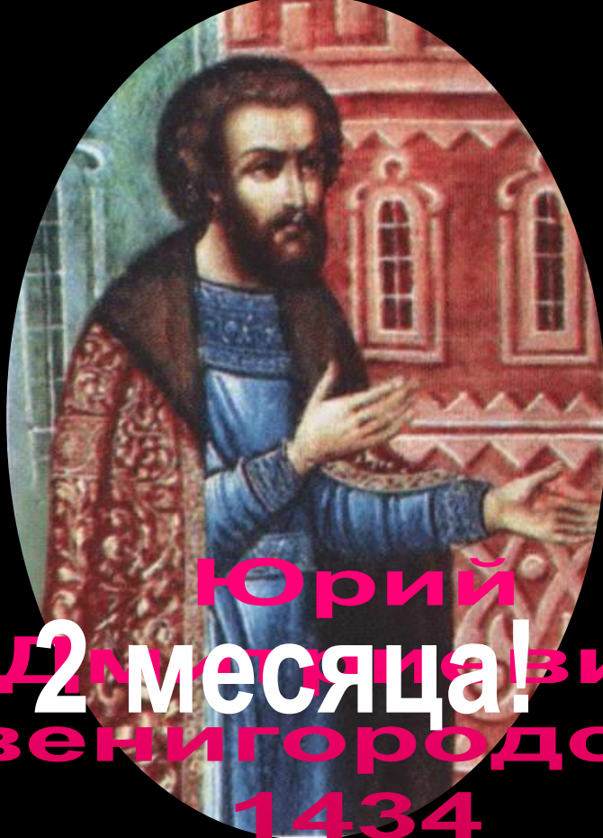
Юрий Дмитриевич Звенигородский 1434