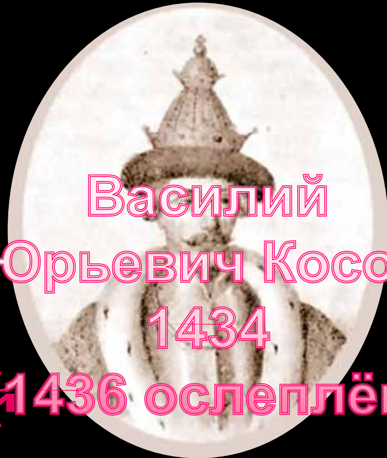
Василий Юрьевич Косой 1434 (1436 ослеплён)