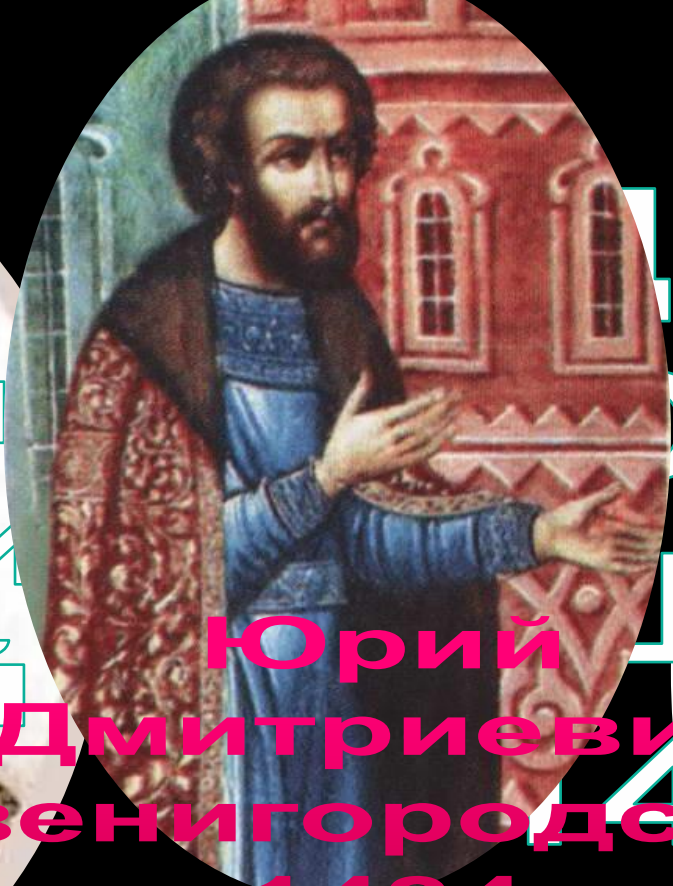
Юрий Дмитриевич Звенигородский 1434