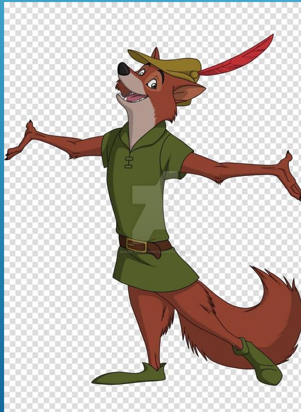
Робин Гуд. Житель средние веков