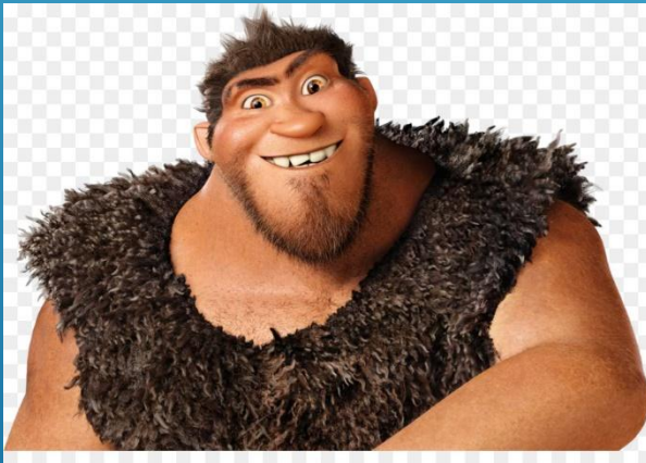
Груд. Человек первобытный