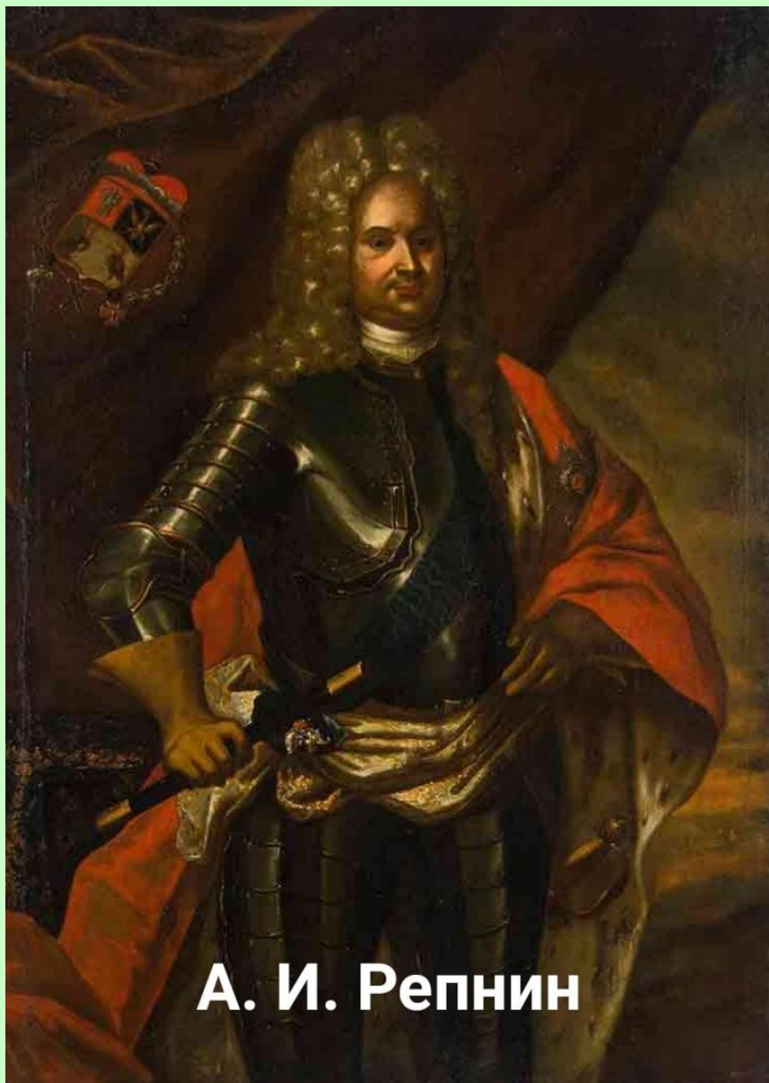
А. И. Репнин

В самом начале XVIII века бывшее дворцовое село Великое было пожаловано Петром I своему сподвижнику, герою Полтавской битвы, князю А. И. Репнину в личное имение. Уже в 1712 году по велению князя в селе был воздвигнут храм Рождества Богородицы - памятник победе в Полтавской битве. Церковь предназначалась для богослужений в летний период. И её высота составила 13 метров - это выше четырёхэтажного дома!