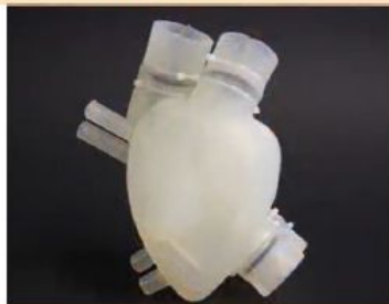
ВЛАДИМИР ДЕМИХОВ изобретатель