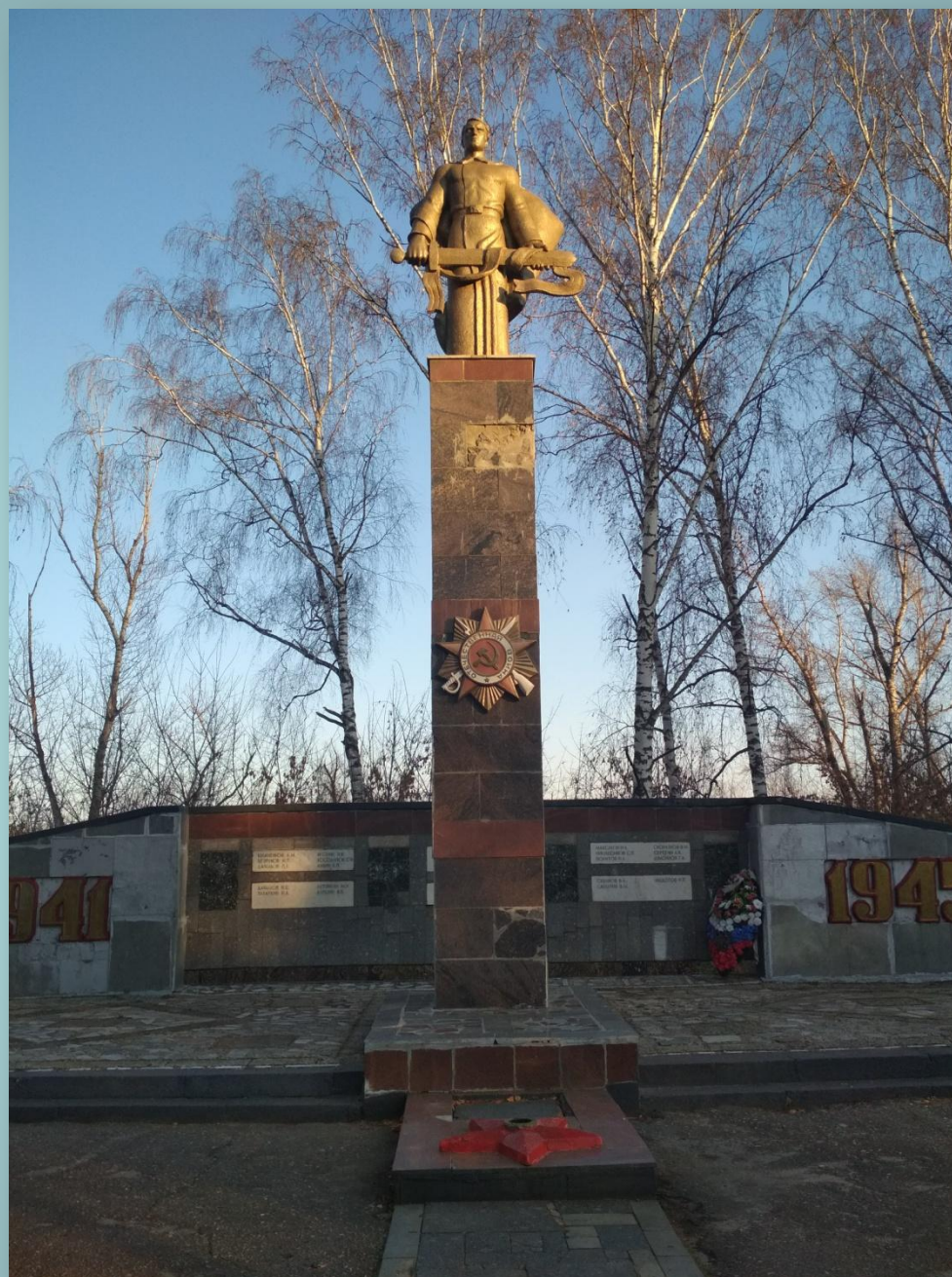
Памятник (пос. Ялга)