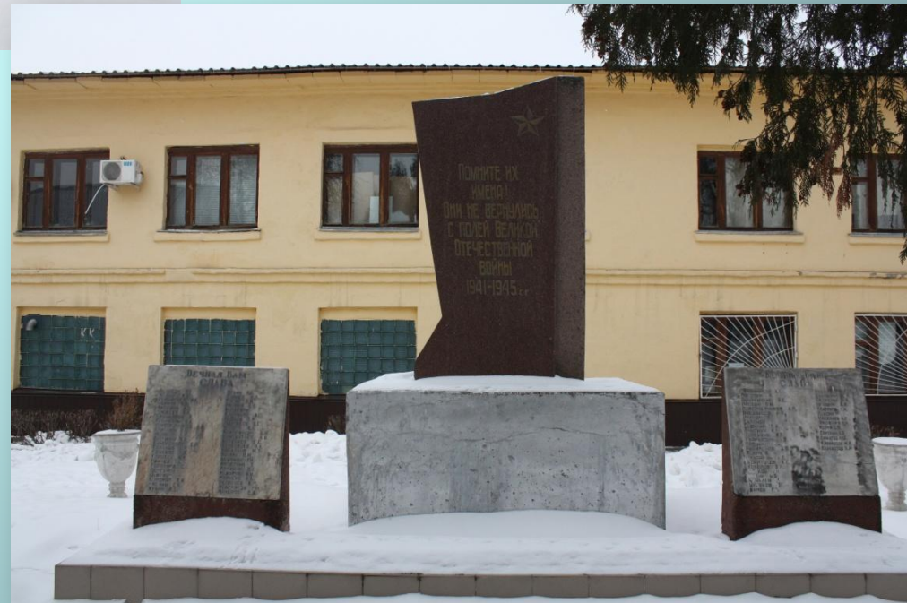
Памятник (ООО «Комбинат Сарэкс»)