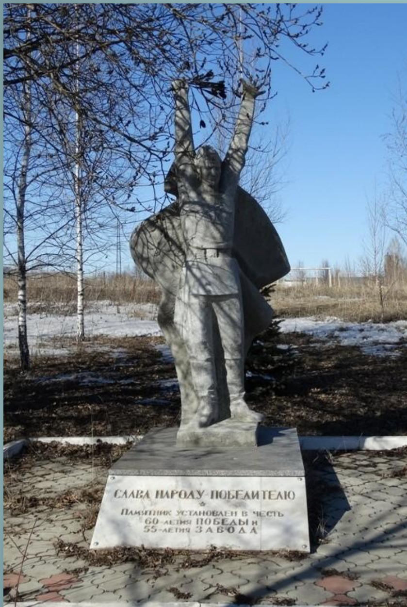
Памятник (ООО «Сарансккабель»)