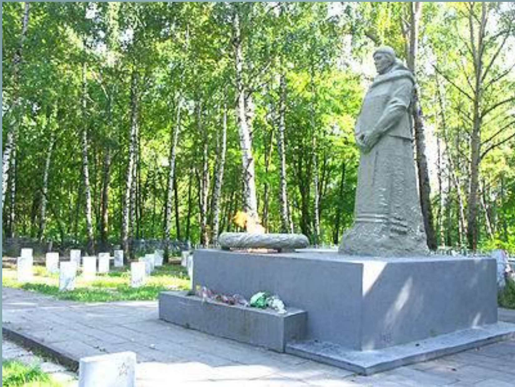
Скульптура "Скорбящая мать" у братской могилы (Мемориальное кладбище)