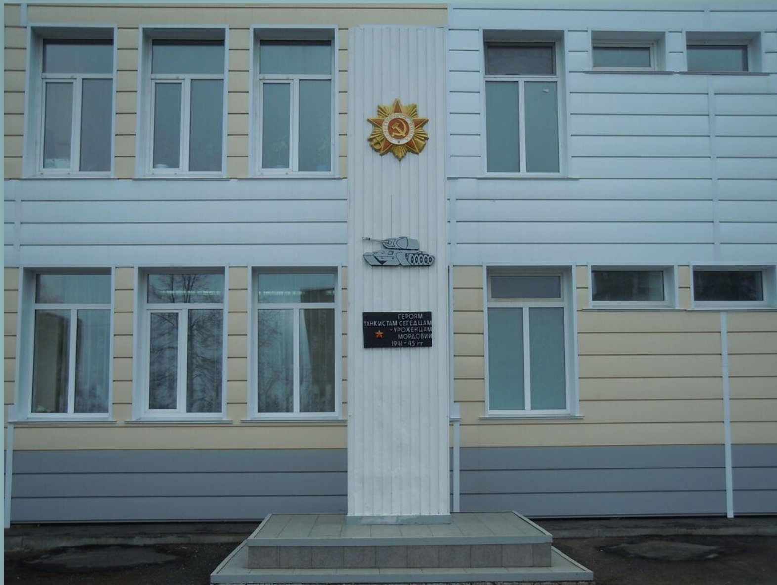
Стела танкистам-сегедцам, уроженцам Мордовии (школа №36, ул. Севастопольская)