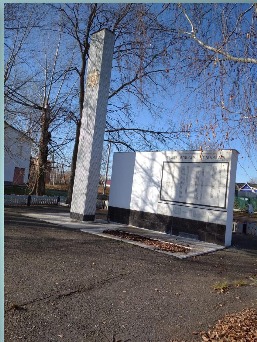
Памятник (с. Монастырское)