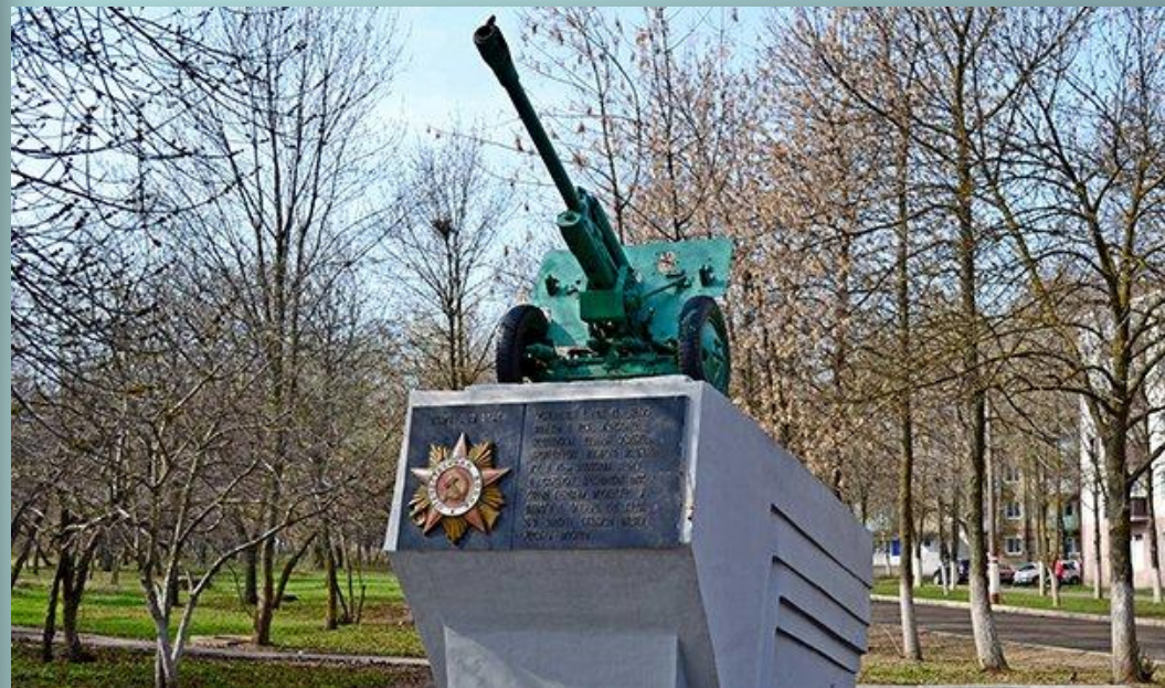
Памятник «Артиллерийская пушка» (ул. Комарова)