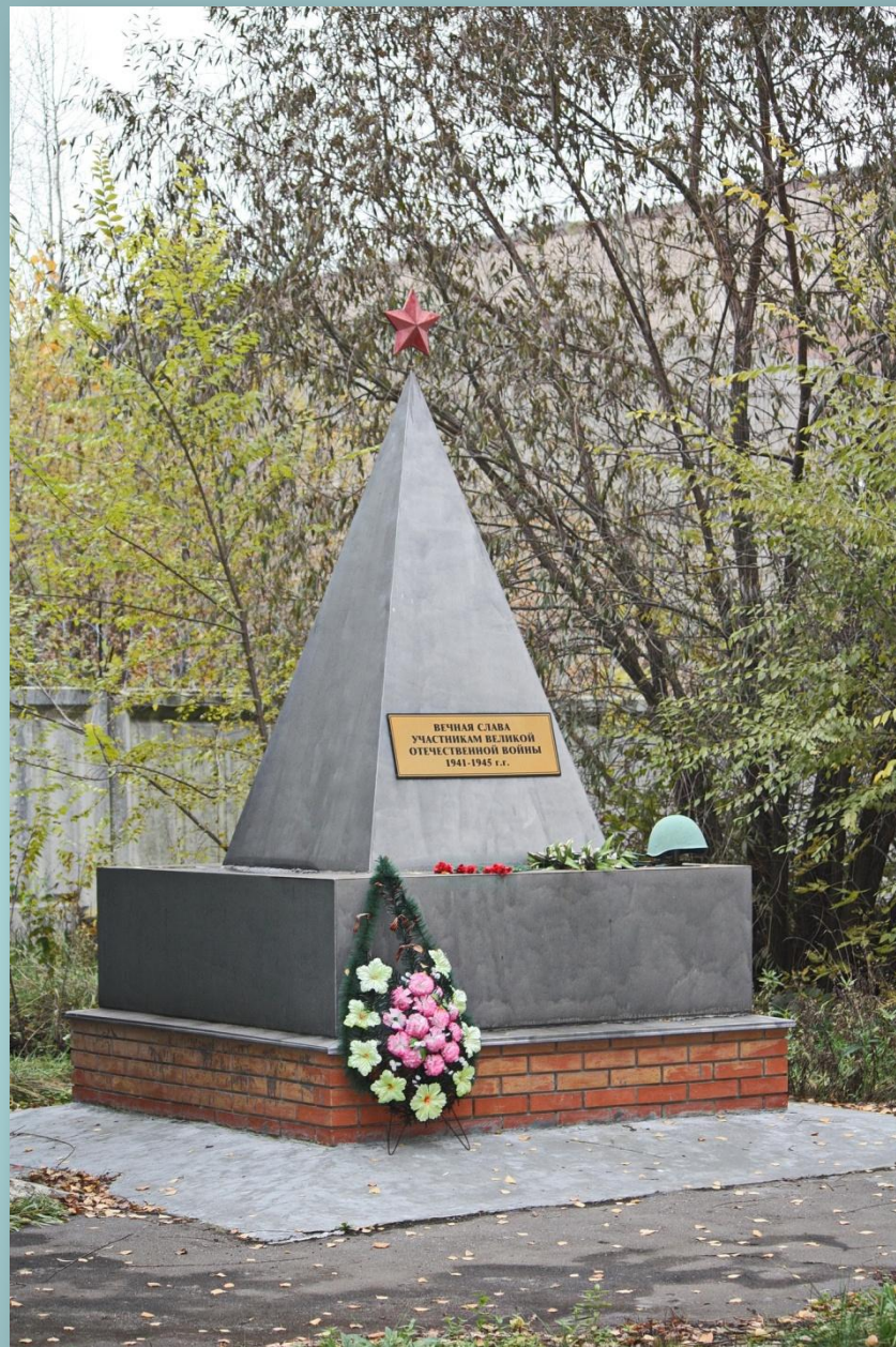
Обелиск (Литейный завод, ныне ООО «ВКМ-Сталь»