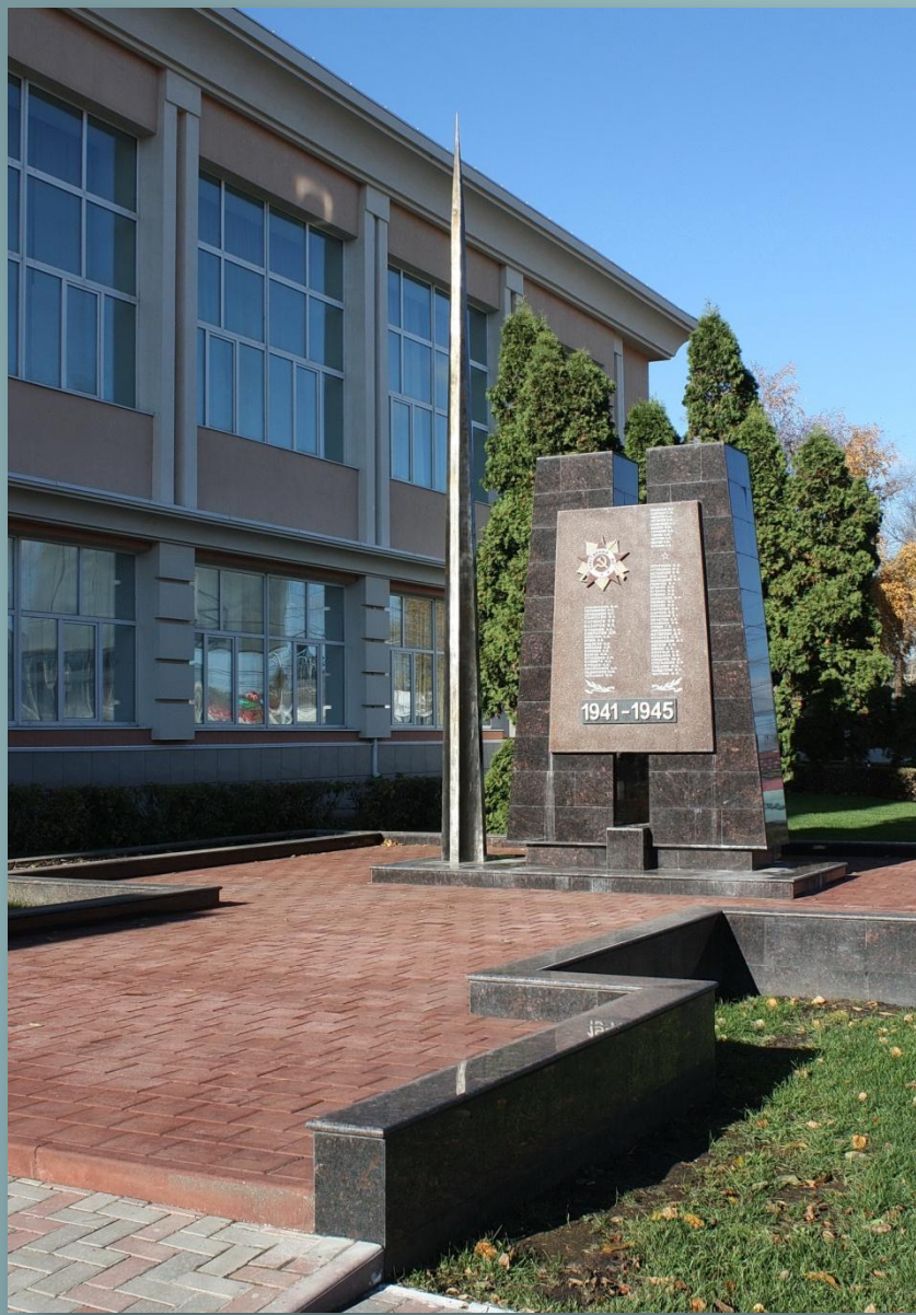
Памятник воинам-студентам и преподавателям МГУ (ул. Большевистская)