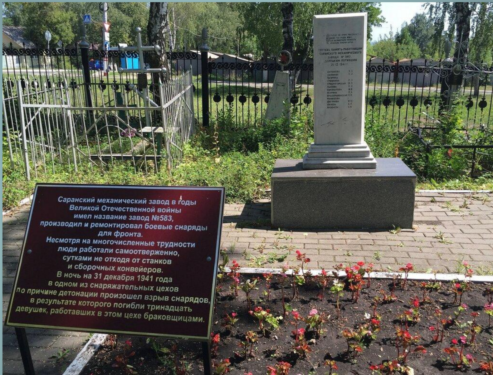
Стела на могиле 13 работниц завода №358 (ныне – Саранский механический завод), погибших 31 декабря 1941 г. (Мемориальное кладбище)