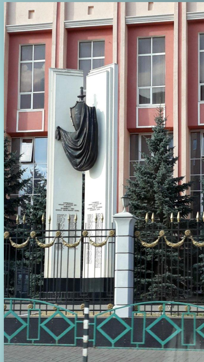
Обелиск у здания МВД (ул. Коммунистическая)