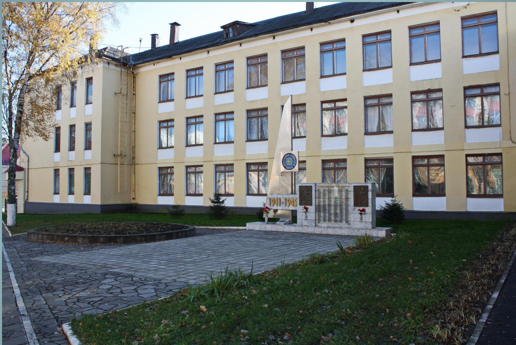
Памятник (АО НПК «Электровыпрямитель»)