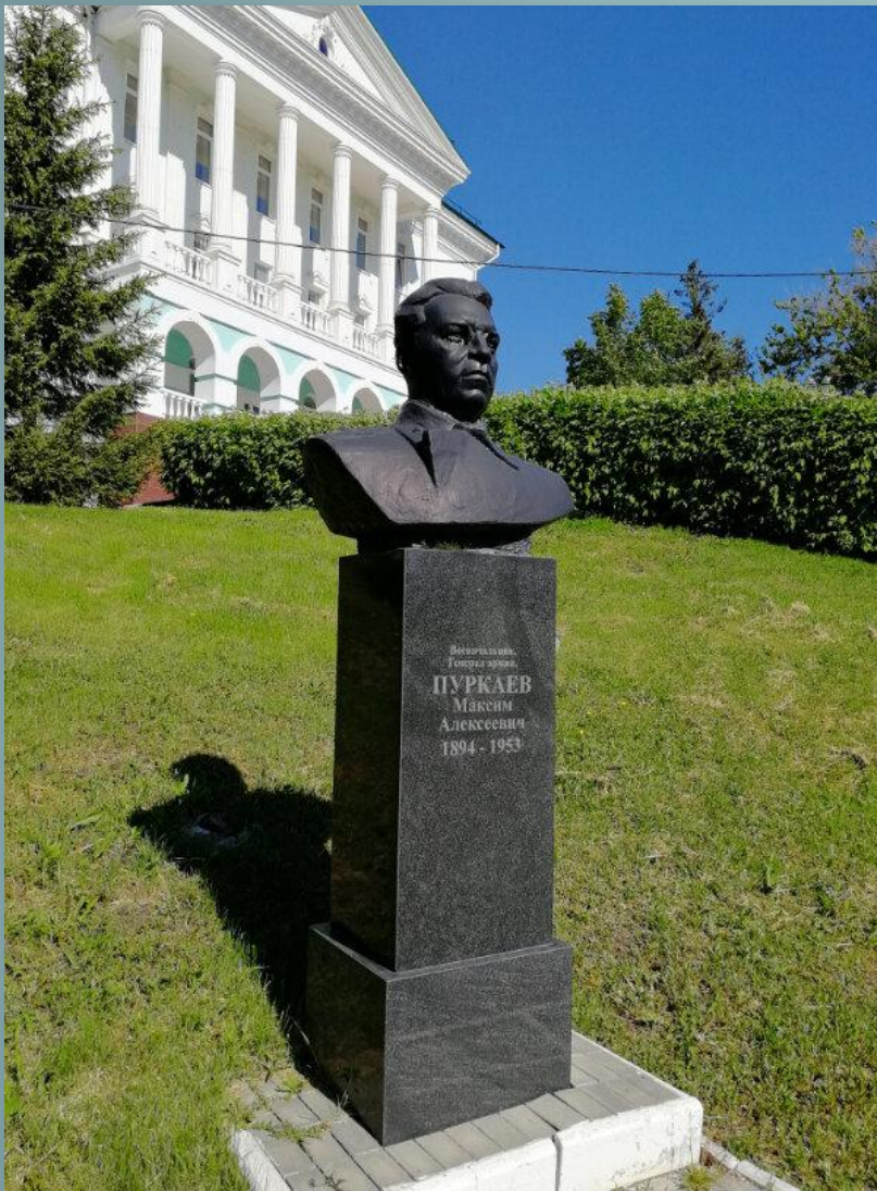
Памятник-бюст генералу М. А. Пуркаеву (Сквер Славы)