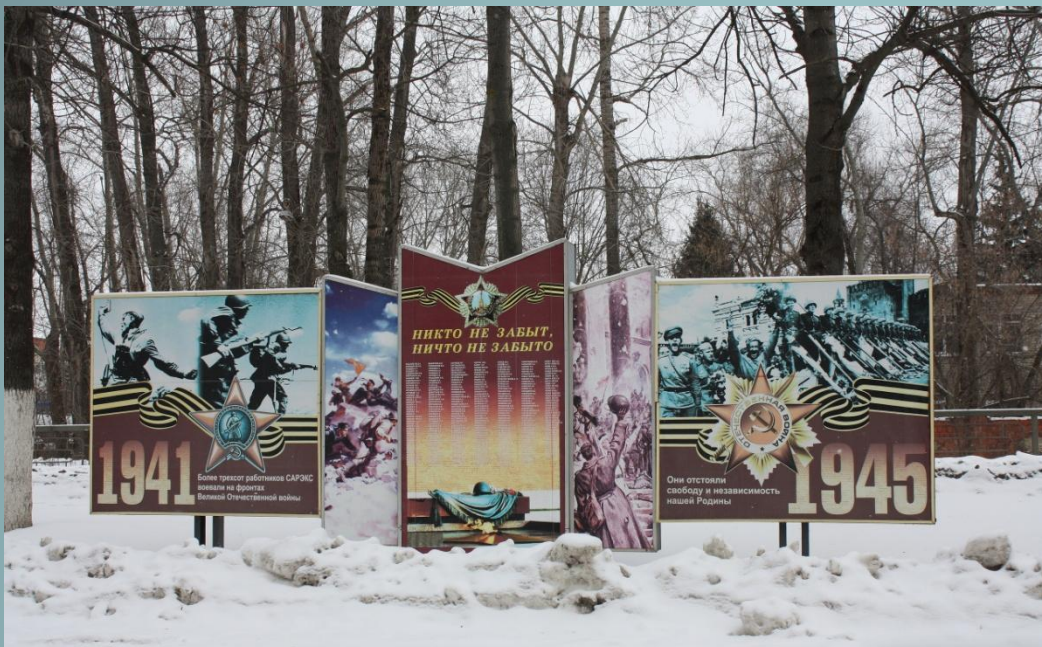
Стела (ОАО «Сарэкс»)