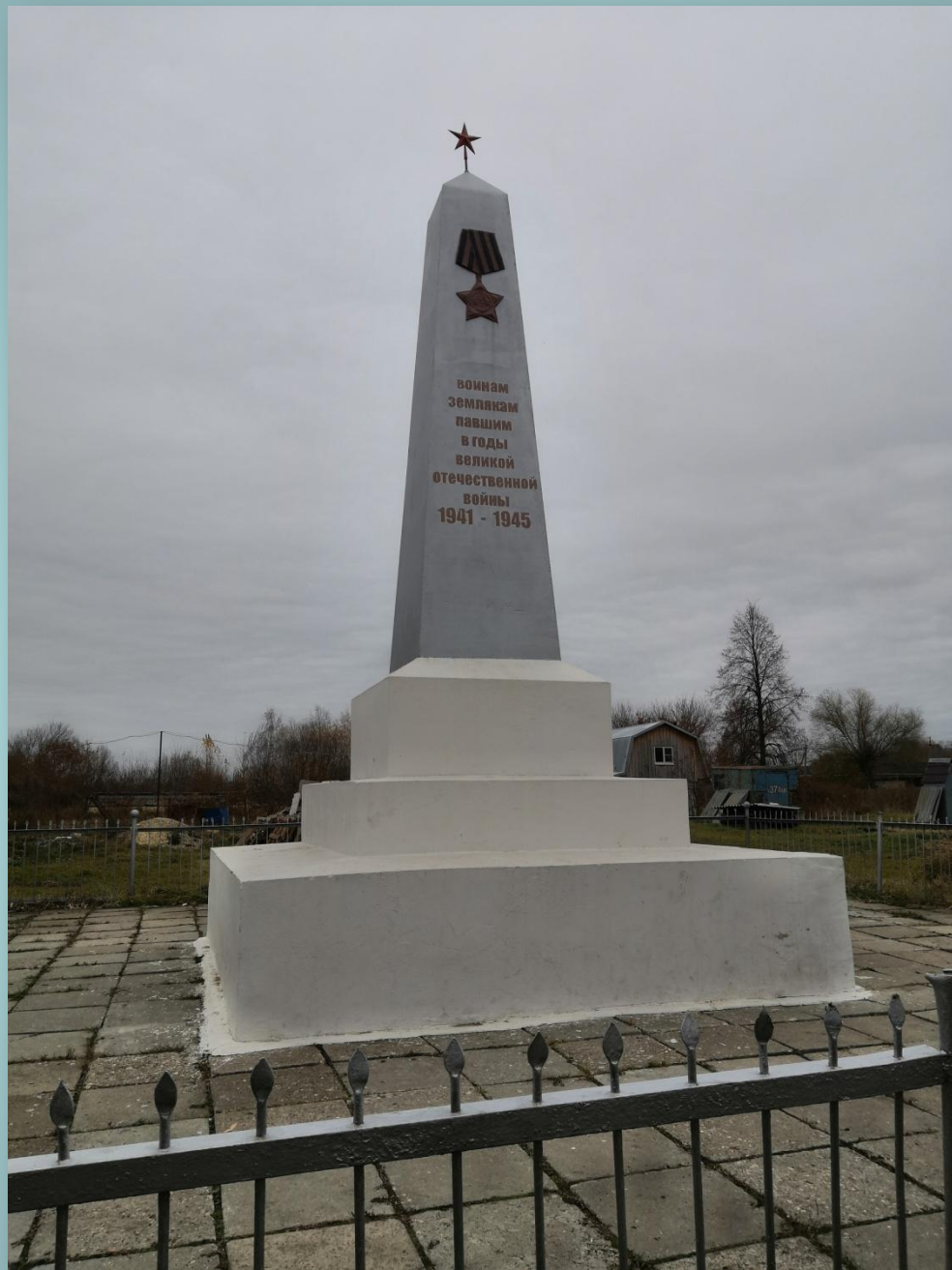
Обелиск (с. Горяйновка)