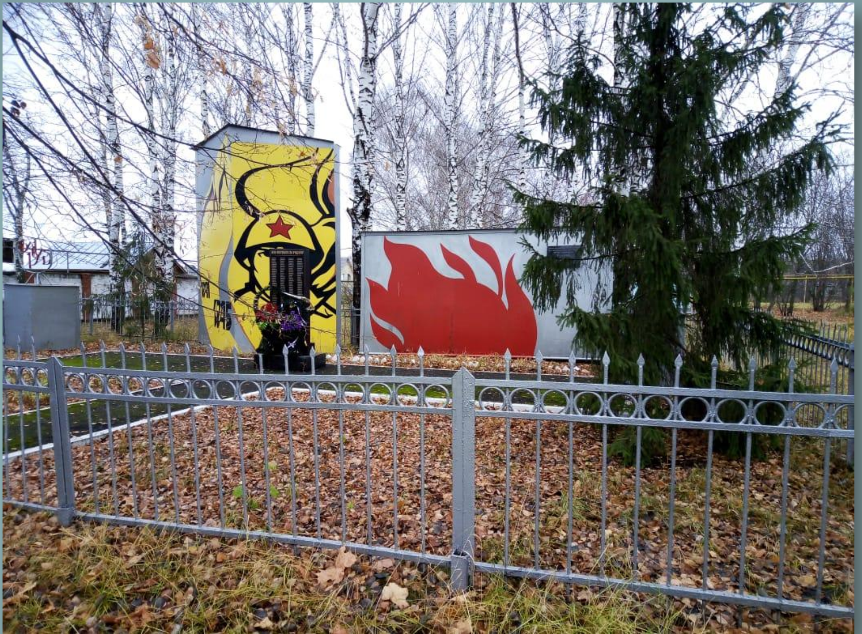
Мемориальный комплекс (с. Напольная Тавла)