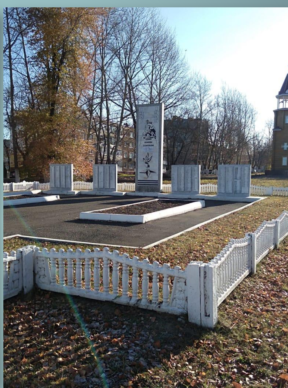
Памятник (п. Луховка)