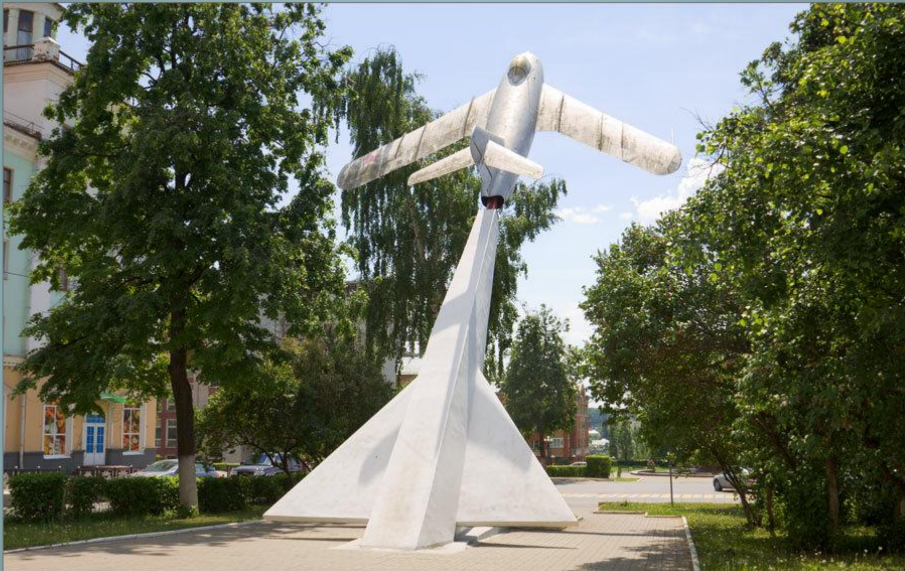
Памятник «Самолет» (ул.Пролетарская)