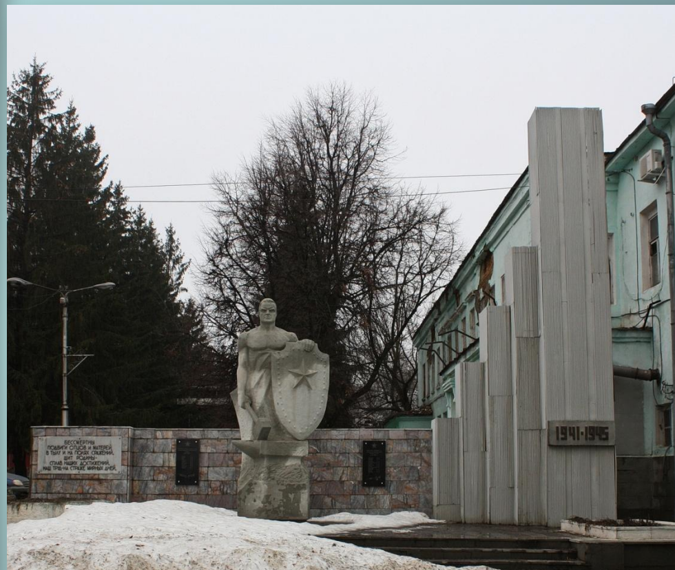
Памятник (ФКП «Саранский механический завод», Промышленный проезд)