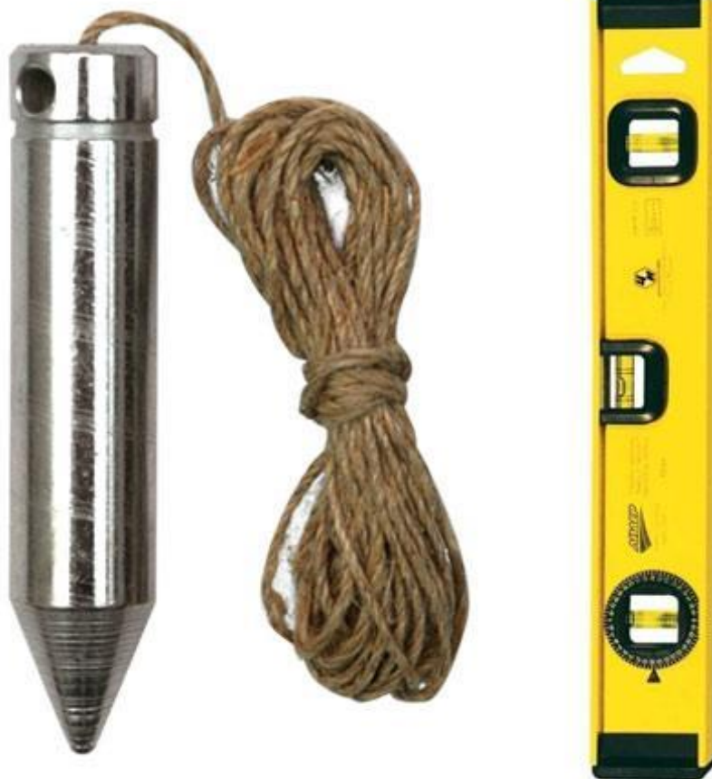
Отвес и строительный уровень