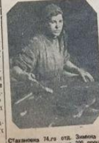
Поэтесса нашла себе работу в газете завода «Электросила».

ЭКОНОМИЮ 20 КИЛОГРАММ МИКОЛЕТТЫ Ваша бригада должна быть лучшей. Ваша бригада должна быть лучшей. Ваша бригада должна быть лучшей. Ваша бригада должна быть лучшей.