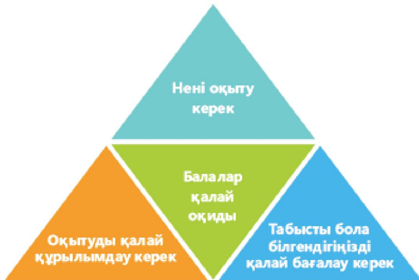
9-сурет. Балаларға оқу қазіпаттарын үйренуде көмек көрсету