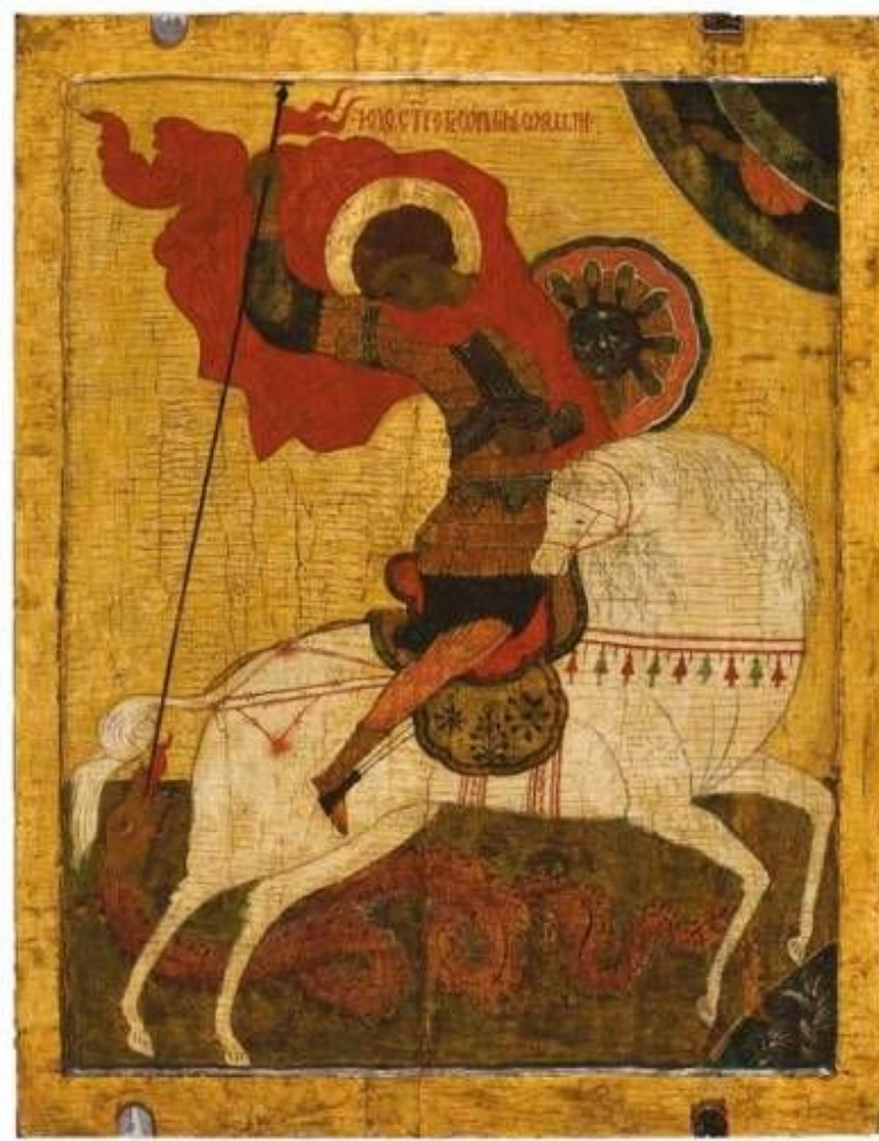
Икона Св.Георгий или «Чудо Георгия о змие». XV в.