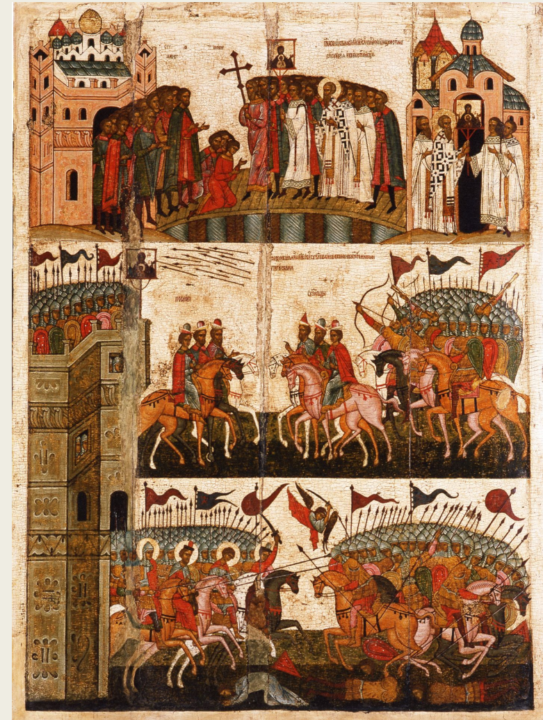
Икона битва суздальцев с новгородцами. 2 половина XV в.