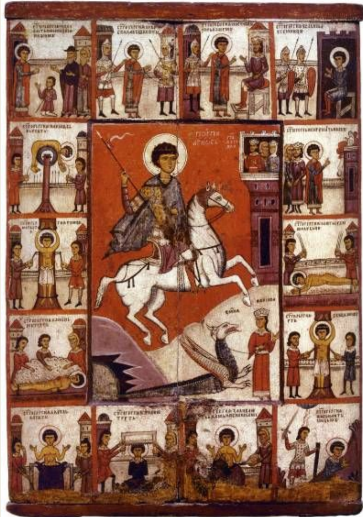
Икона Св.Георгий. XIV в