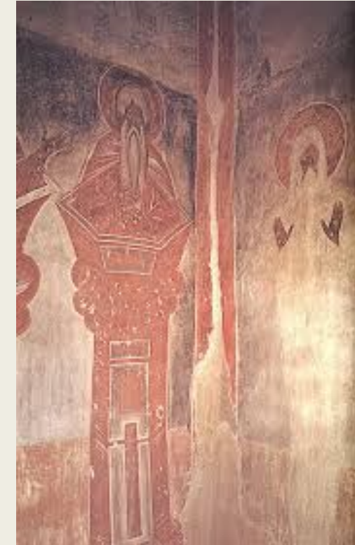
Макарий Египетски й