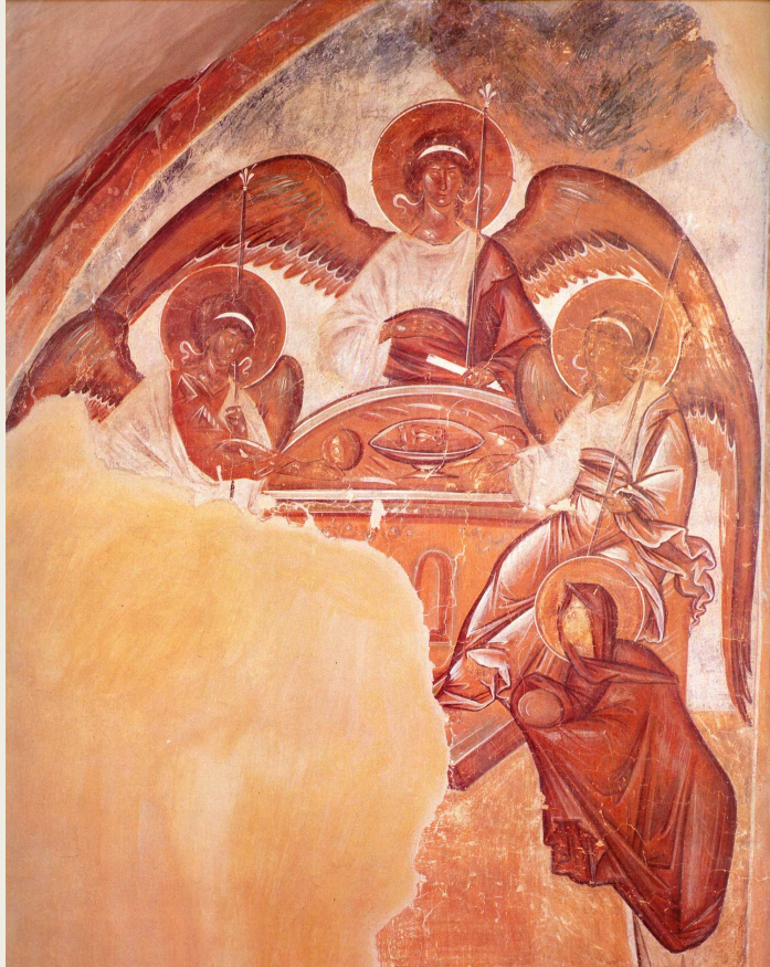
Феофан Грек. Троица. Фреска церкви Спаса Преображения на Ильине улице в Новгороде. 1378.