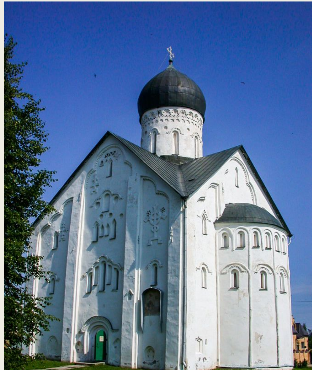
Церковь Спаса Преображения на Ильине- улице. 1374.