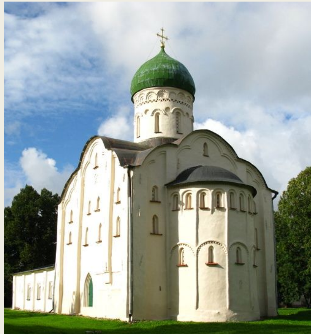
Церковь Федора Стратилата на Ручье. 1360