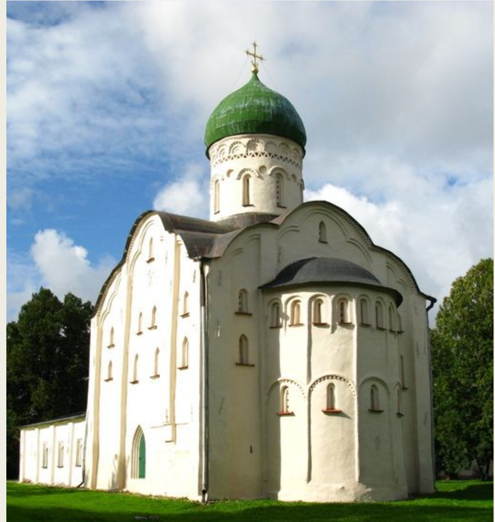
Церковь Федора Стратилата на Ручье. 1360