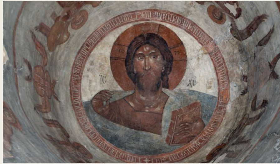
Роспись церкви Спаса Преображения на Ильине-улице. Христос – Пантократор. 1378