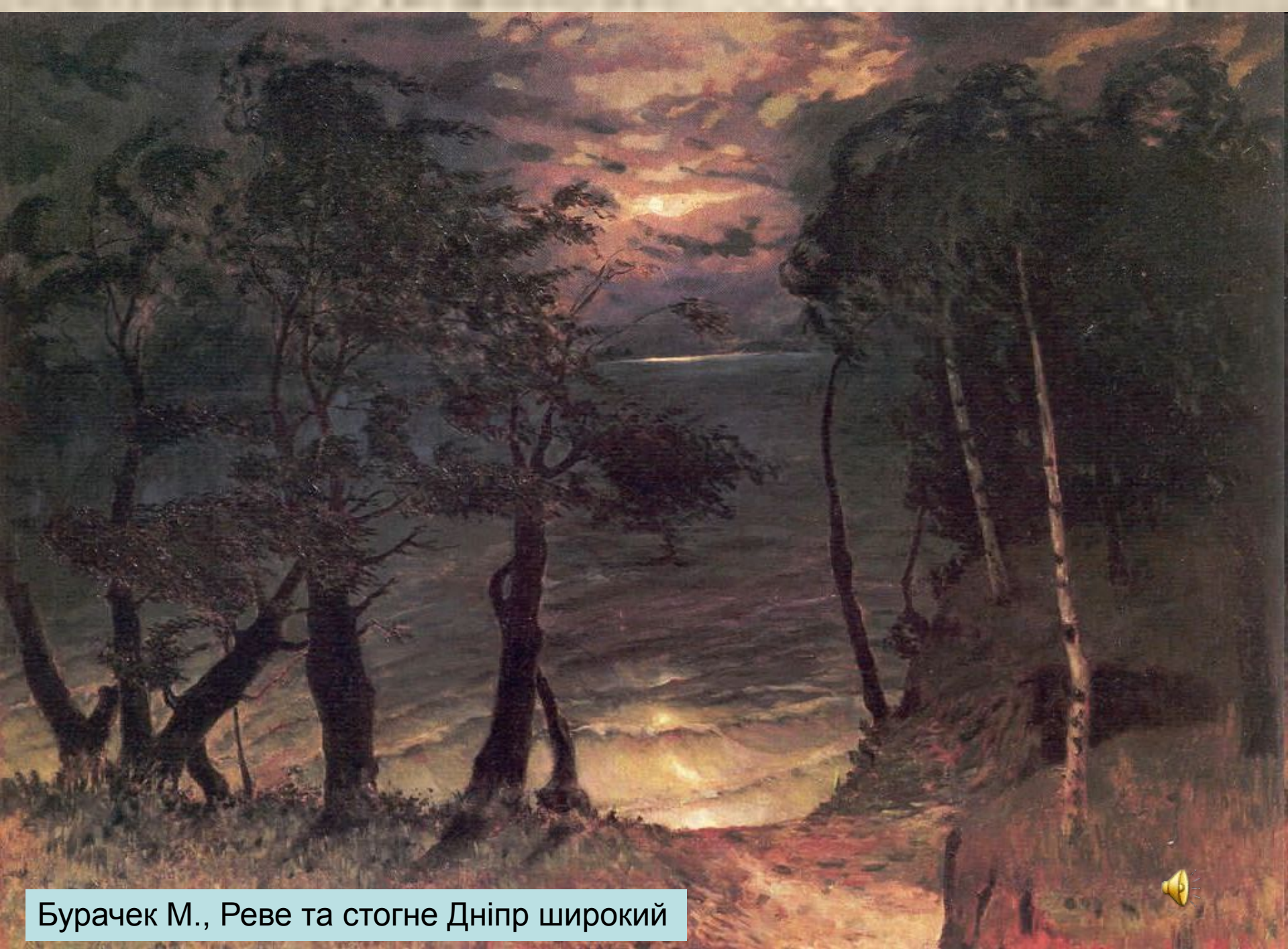
Бурачек М., Реве та стогне Дніпр широкий