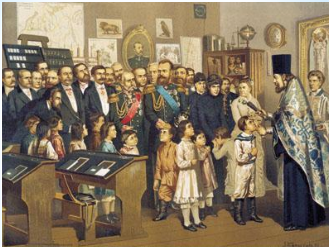
Кившенко А. Освящение народной школы в присутствии цесаревича Александра Александровича. 1880.

Распространялись церковно-приходские школы.