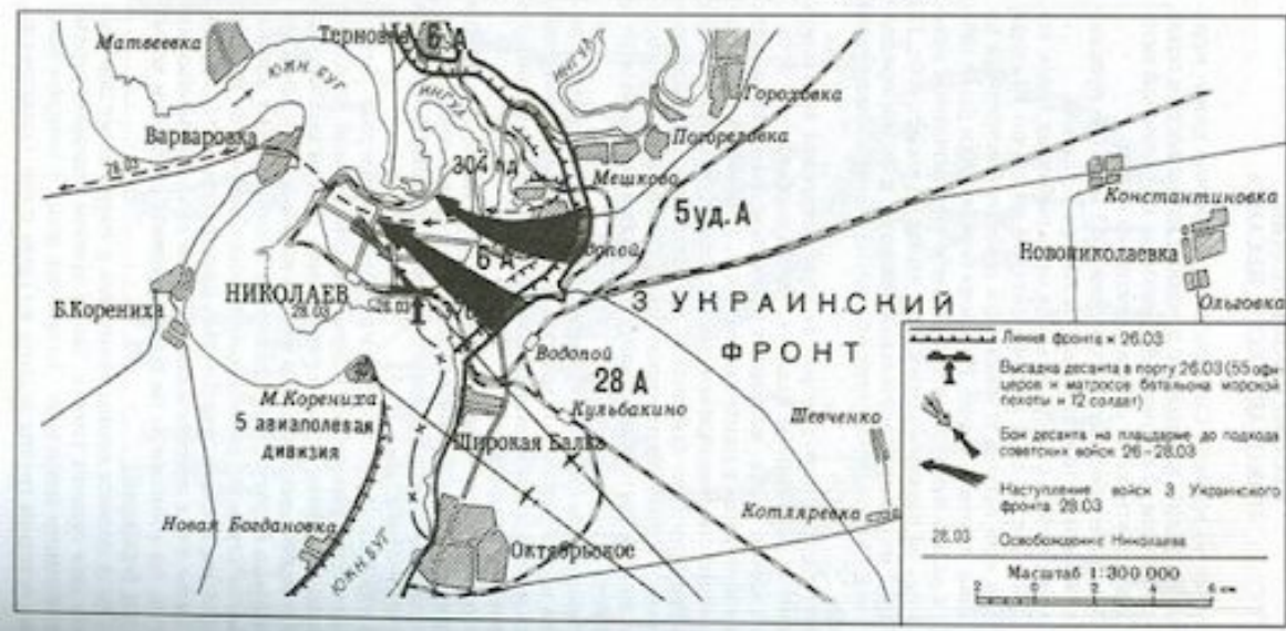
Боевые действия десантного отряда 384-го отдельного батальона морской пехоты Черноморского флота при освобождении г. Николаева 26-28 марта 1944 г.