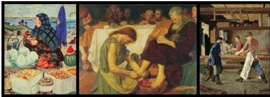
3. ремесленники, торговцы, слуги (жители городов)