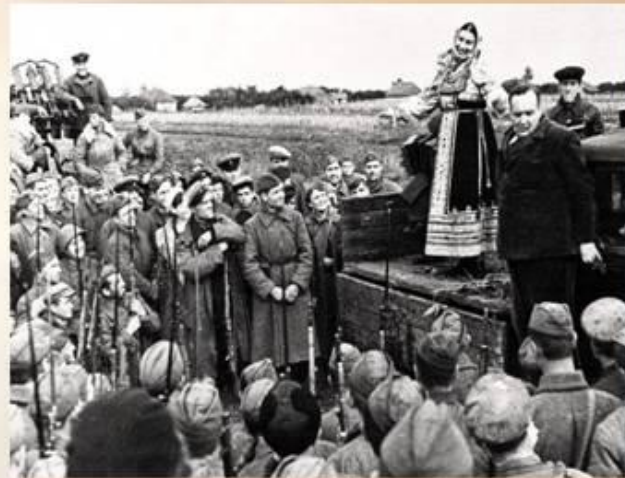
Лидия Русланова выступает перед бойцами

Наибольшую популярность песня получила во время войны.