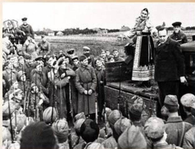
Лидия Русланова выступает перед бойцами

Наибольшую популярность песня получила во время войны.