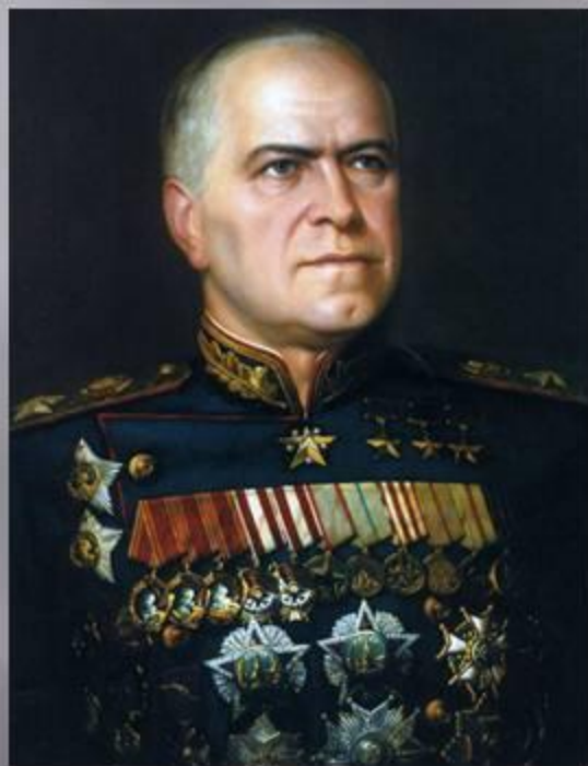
Маршал Советского Союза Г.К. Жуков.

В стране была невероятной популярностью военных, опасаясь этого Сталин начал новые репрессии против армии. Арестованы были маршал авиации Новиков, генералы Понеделин, Кириллов. Сам Жуков был обвинен в неуважении к Сталину и высокомерии.