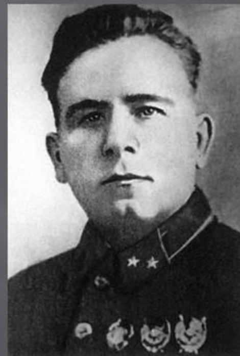
Генерал армии П.Понеделин.