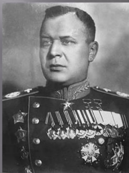
Маршал авиации А.Новиков