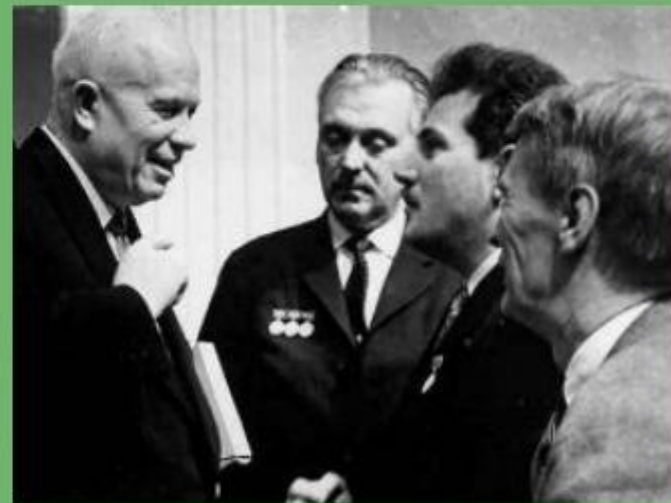
Н.С.Хрущев и деятели культуры.

Кинематограф добился огромных успехов. Фильм «Летят журавли»(М.Калатозов) получил Гранпри фестиваля в Каннах, а «Иваново детство»(А.Тарковский в Венеции.)