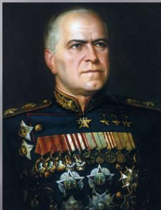
Маршал Советского Союза Г.К. Жуков.

В стране была невероятной популярностью военных, опасаясь этого Сталин начал новые репрессии против армии. Арестованы были маршал авиации Новиков, генералы Понеделин, Кириллов. Сам Жуков был обвинен в неуважении к Сталину и высокомерии.