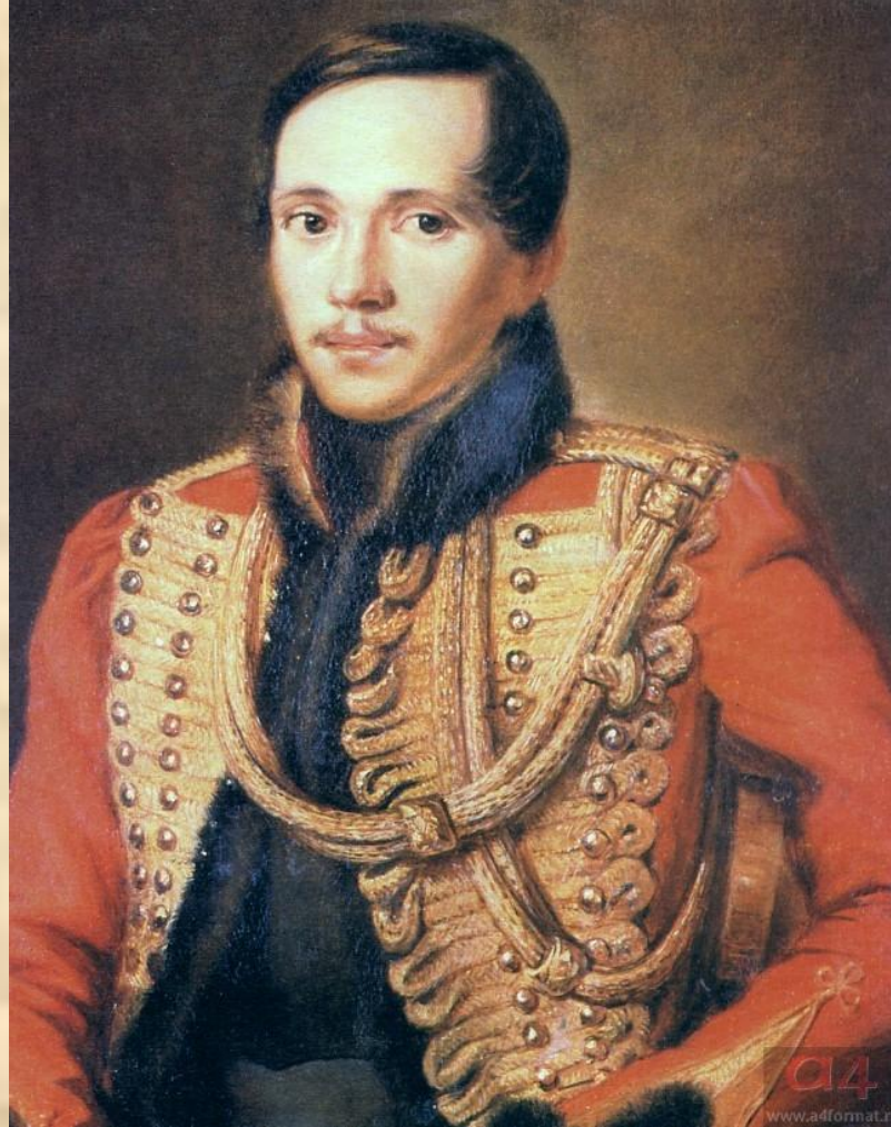
М.Ю.Лермонтов в ментике лейб-гвардии гусарского полка. Художник П.Е.Заболотский. 1837