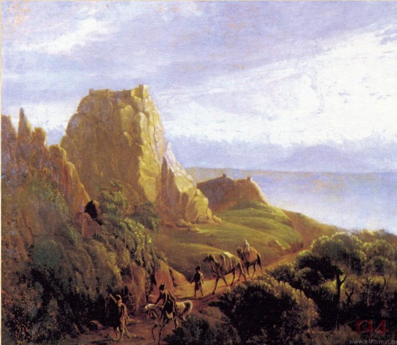
М.Ю.Лермонтов «Окрестности селения Караагач». 1837 - 1838