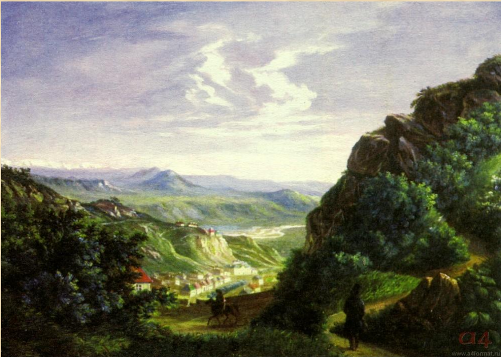
М.Ю.Лермонтов «Вид Пятигорска». 1837