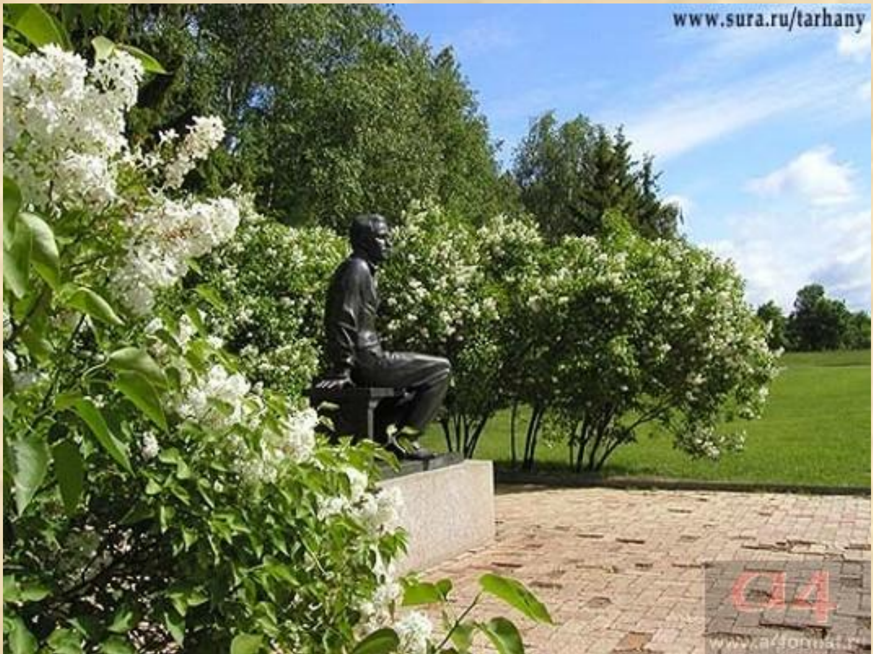
Памятник М.Ю.Лермонтову в Тарханах.