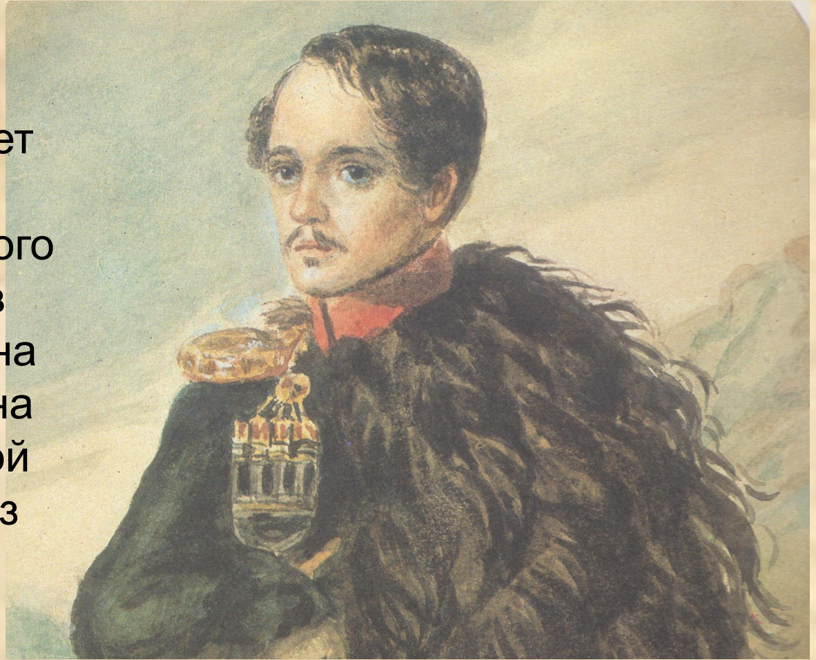
«Лермонтов. Автопортрет». Акварель. 1837

Лермонтов изображает себя на фоне гор в мундире Нижегородского драгунского полка: в черкеске с газырями на груди, наброшенной на плечо бурке, с шашкой на поясе. Это один из лучших и достовернейших портретов поэта