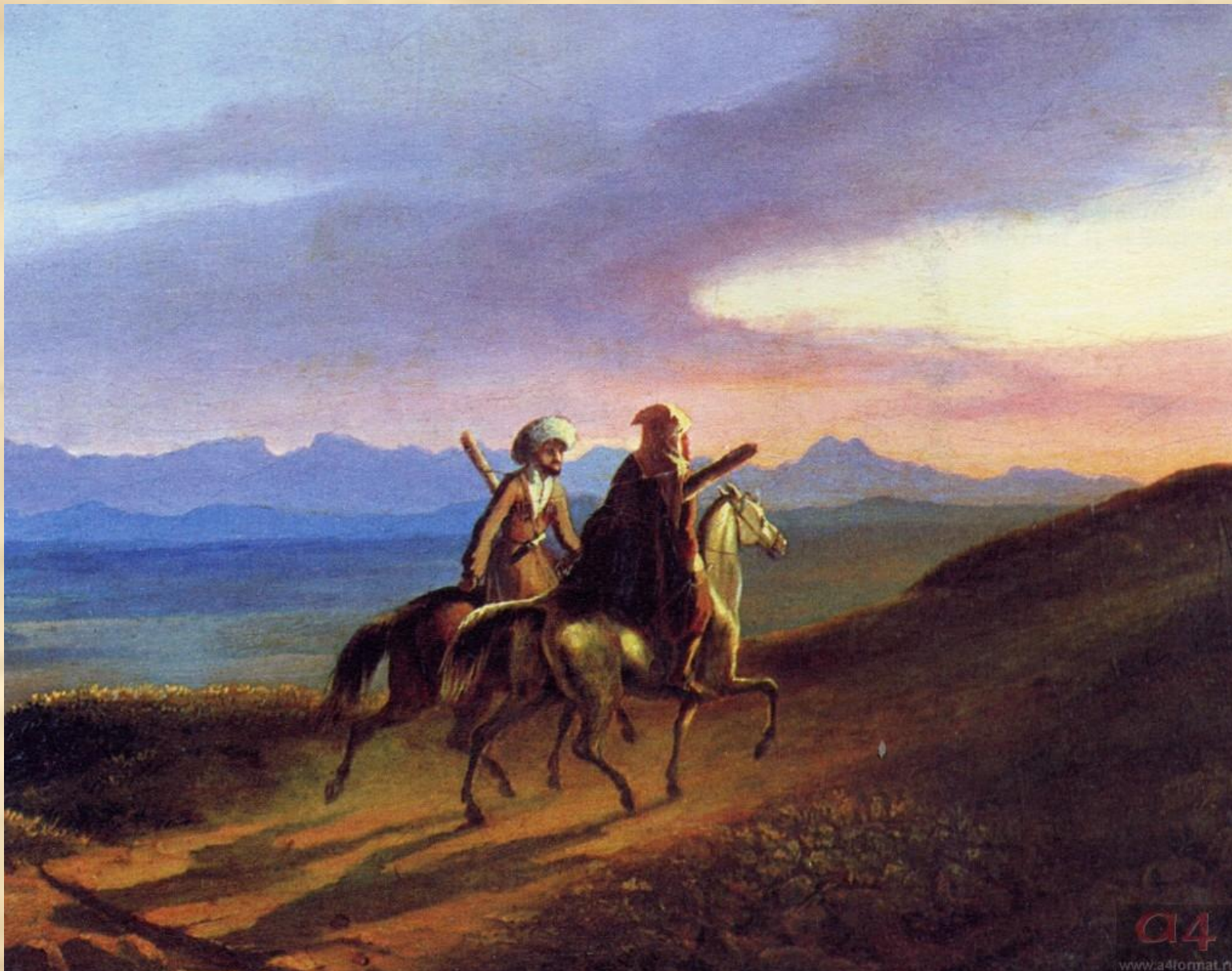
М.Ю.Лермонтов «Воспоминания о Кавказе». 1838