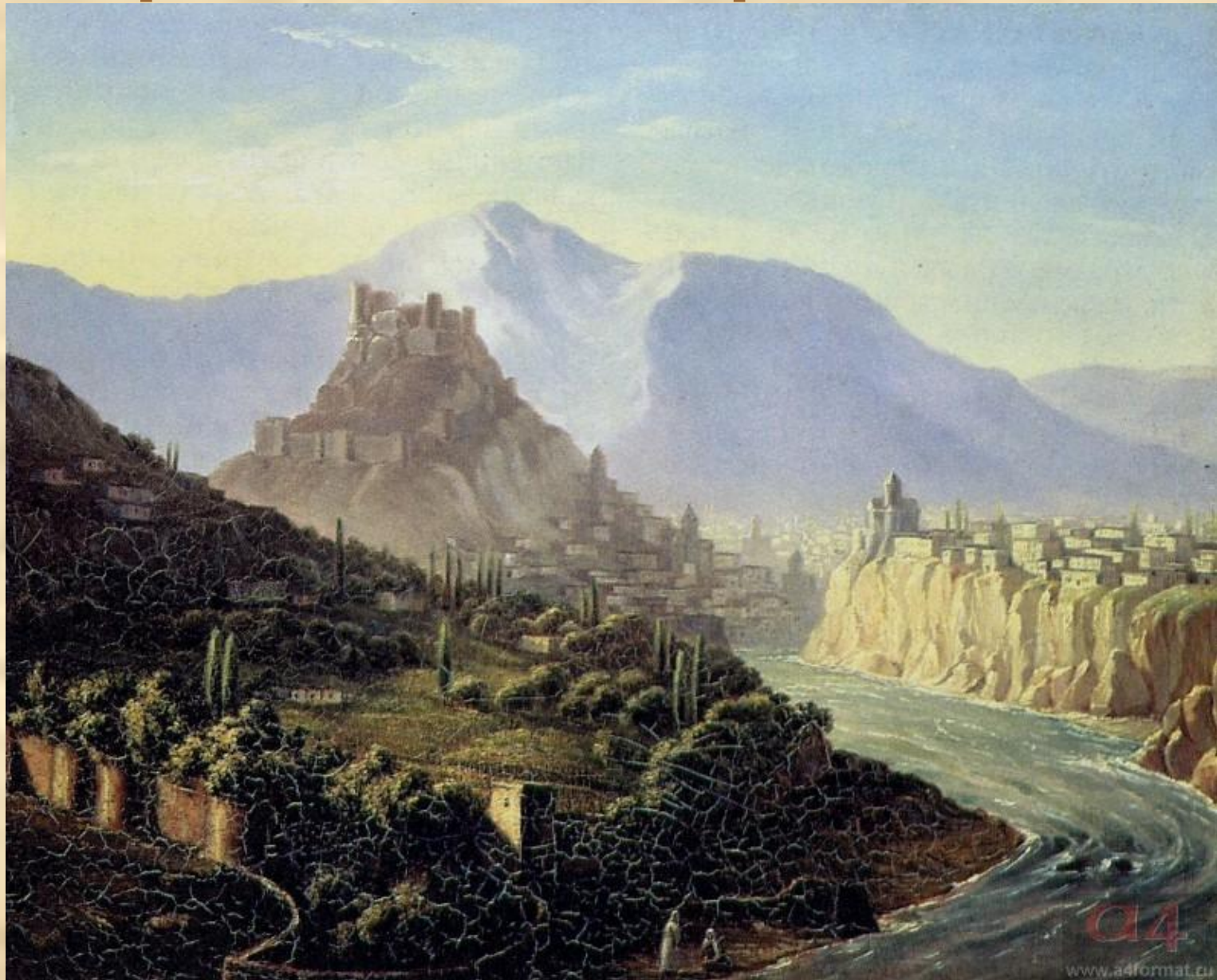
М.Ю.Лермонтов «Тифлис». 1837