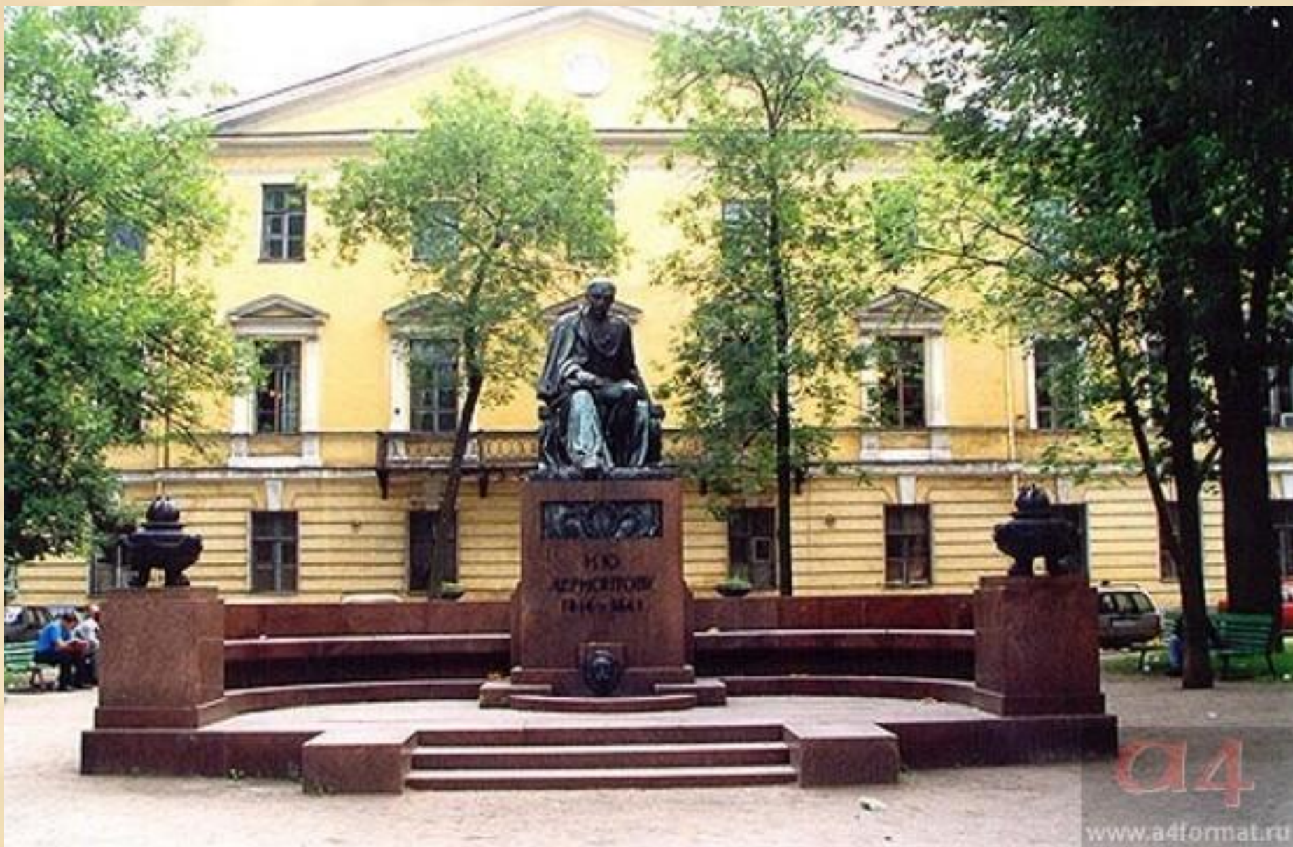
Памятник М.Ю.Лермонтову в Санкт-Петербурге.