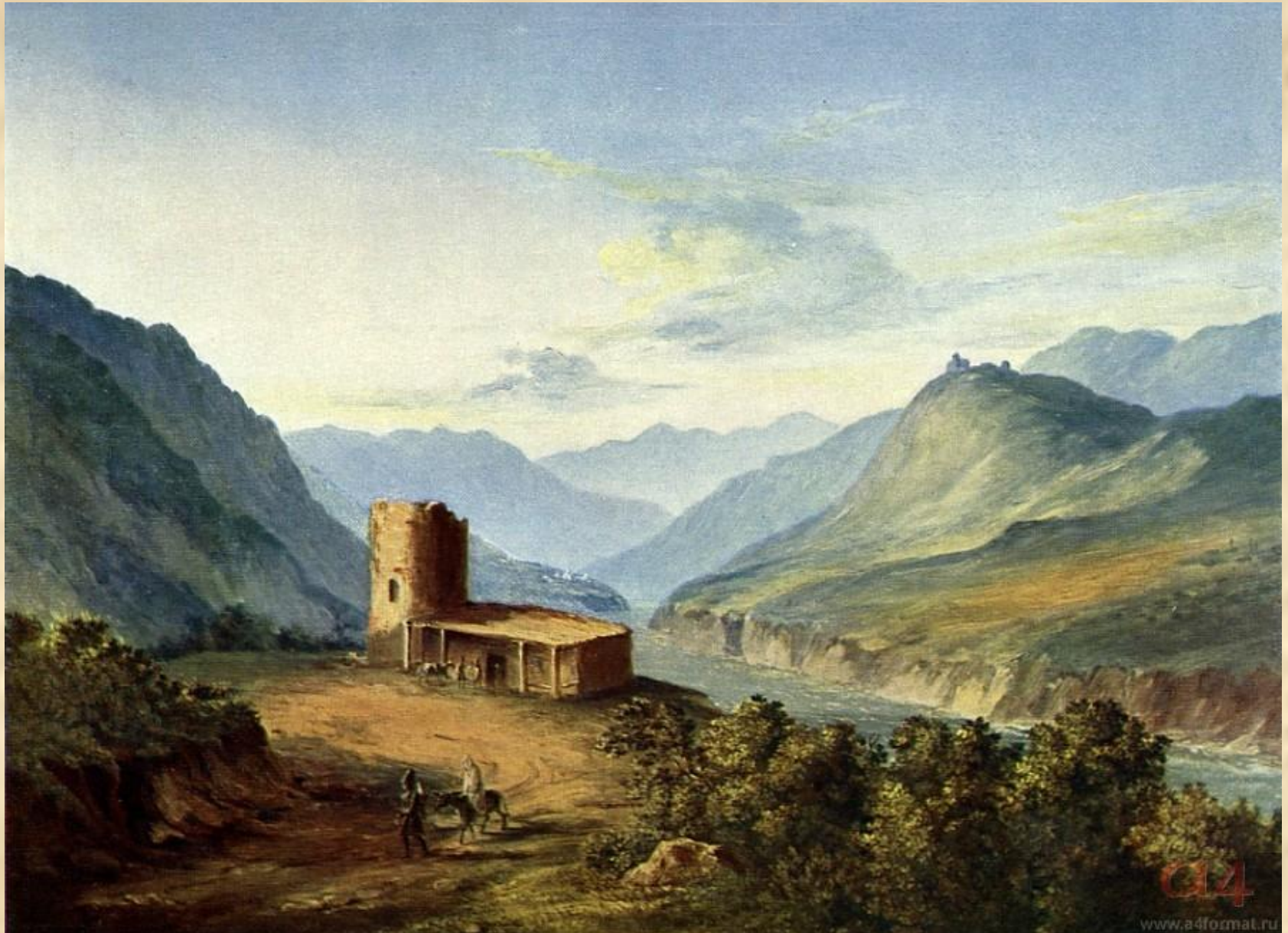
М.Ю.Лермонтов «Военно-грузинская дорога близ Мцхета». 1837