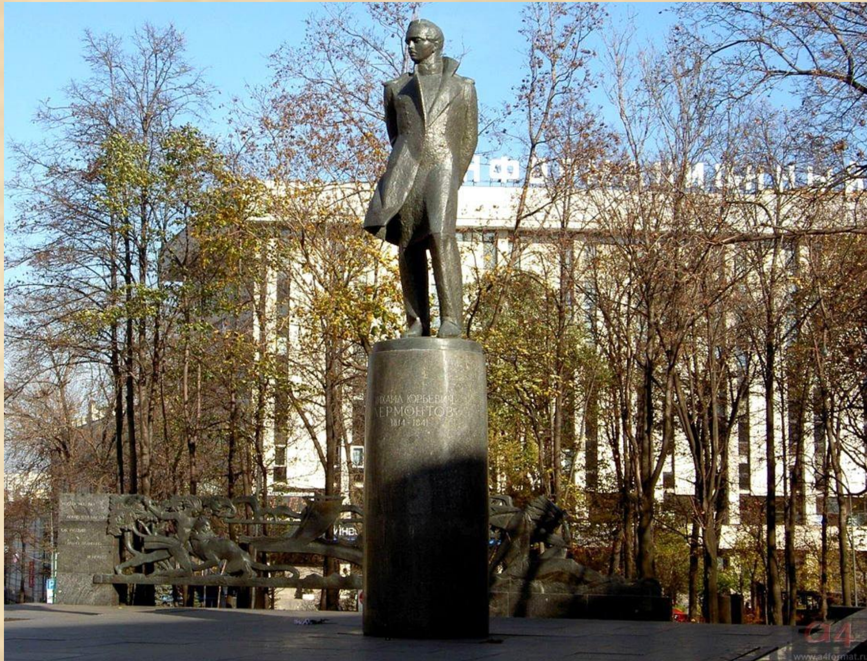
Памятник М.Ю.Лермонтову в Москве. 1965