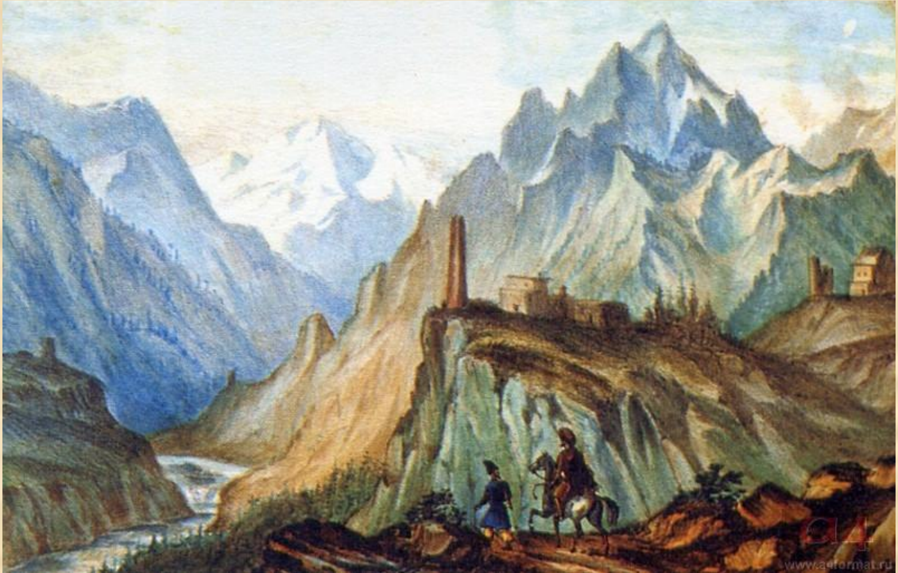
М.Ю.Лермонтов «Вид Крестовой горы из ущелья близ Коби». 1837 - 1838