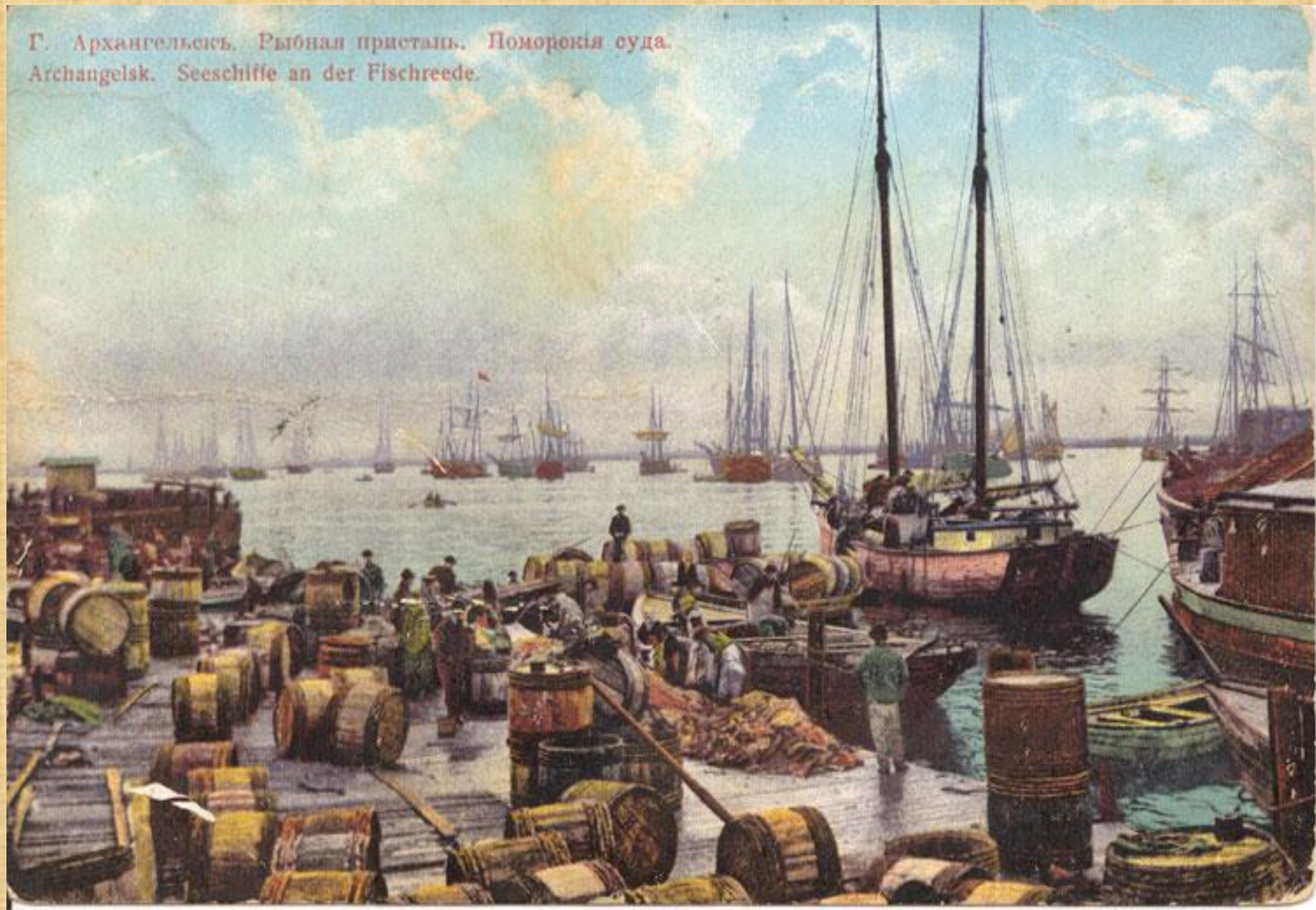
Г. Архангельскъ. Рыбная пристань. Поморскія суда. Archangelsk. Seeschiffe an der Fischreede.