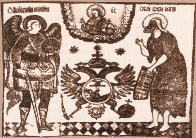
Знамя Архангельского полка

В годы первой Отечественной войны (1812 года) Архангельск отправил в действующую армию отряд из 3400 человек. Архангельский и Двинской пехотные полки, сформированные в Архангельске из поморов, в ходе Бородинской битвы защищали знаменитые Багратионовы флеши. Военный Архангельский порт создал и направил на Балтийское море отряд из восьми кораблей. В составе англо-русской эскадры корабли участвовали в блокировании портов Франции.