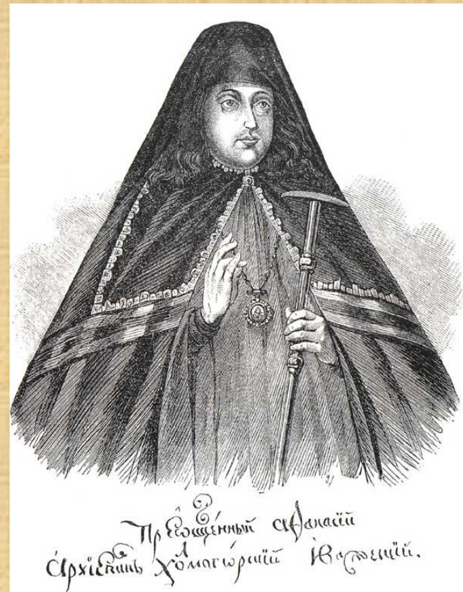
Прѣдшественникъ Афанасіи Архіепископъ Холмогорскій Варлаамъ.

В 1682 году была учреждена Архангельская епархия. Ее задачами определялись борьба с распространением раскола и церковный надзор за отдаленным краем. Первым епископом Архангельской епархии был Афанасий Холмогорский (годы жизни - 1641-1702). Афанасий был не только умелым церковным администратором, но и тонким политиком. Понимая, что старую веру невозможно сломить одним ударом, он повел в большей степени светскую политику: стал организатором первой русской частной обсерватории (1692 год), библиотеки, иконописной школы, автором «Реестра из докторских книг», рассказывающего о приготовлении и применении лекарств. Холмогорская и Архангельская епархия была переселена в Архангельск в 1762 году.