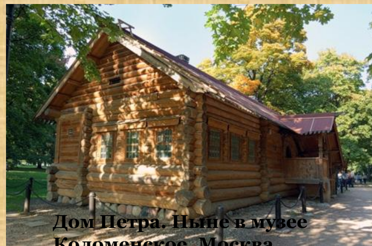
Дом Петра. Ныне в музее Коломенское, Москва