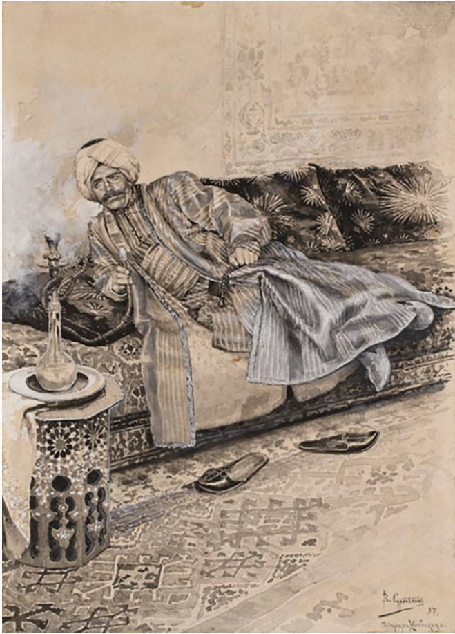
«Хан Гирей» иллюстрация к поэме, автор: Вардгес Суренянц

Пушкинский «хан» — славный воин и обладатель роскошного гарема. Гирей, подобно герою байроновской «Абидосской невесты», мрачно восседает в кругу приближенных; его янтарный чубук потух; он погружен в невеселые думы — о причине которых читатель узнает значительно позже. Но при этом фабула резко смещена (а значит, изменен статус образа): в числе персонажей «индивидуалист» отсутствует; формально главным героем становится хан Гирей; однако реально он оттеснен в тень двух героинь — Марии и Заремы. Слезная задумчивость — эта отличительная черта многих пушкинских героев — настигает Гирея подчас даже во время сечи. И как конфликт Заремы и Марии отражает борьбу между «мусульманским», восточным, и — «христианским», европейским, началами, проникшими в его сердце, так воплощает ее и «фонтан слез», устроенный в память о двух во всем противоположных возлюбленных Гирея: «беззаконный символ», крест, венчает «магометанскую луну». Позже Пушкин вообще признал характер Гирея неудачным, «мелодраматическим»