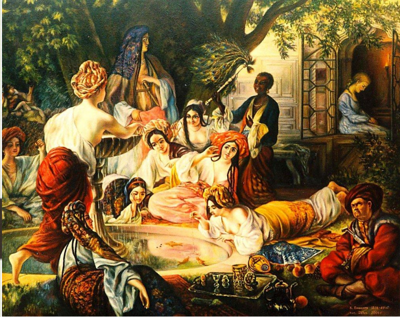
Картина Карла Брюллова «Бахчисарайский фонтан»

Эпический сюжет в поэме соседствует с лирическими отступлениями: татарская песня, которую поют наложницы, восхваляя Зарему; описание пленительной бахчисарайской ночи; чувства, вызванные у лирического героя видом дворца Бахчисарая. Лирическое обращение к собственной возлюбленной Пушкин сократил, выпустив, как он выразился, «любовный бред». Но несколько стихов сохранилось в рукописи и печатается в современных редакциях.