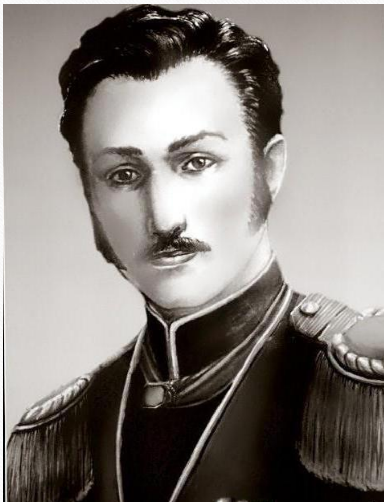
Портрет Хана Гирея