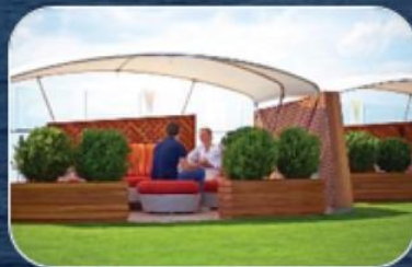
НАСТОЯЩИЙ ЗЕЛЕНый ГАЗОН