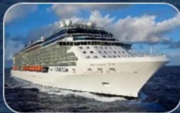
САМЫЙ СОВРЕМЕННЫЙ ЛАЙНЕР