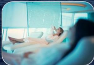
СПА И РАССЛАБЛЯЮЩИЕ ПРОЦЕДУРЫ