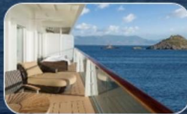
КАЮТЫ С БОЛЬШИМ БАЛКОНОМ