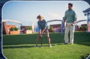
ЛУЖАЙКА ДЛЯ ГОЛЬФА