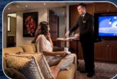
НА КАЖДЫХ ДВУХ ГОСТЕЙ ПРИХОДИТСЯ 1 СТЮАРД