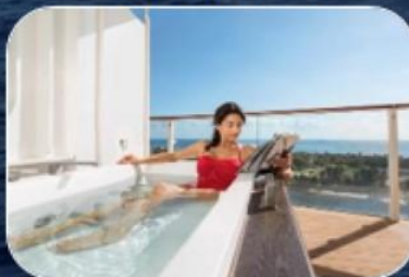
ПЕНТХАУС С ДЖАКУЗИ