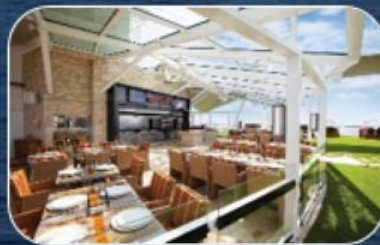
ГРИЛЬ НА ПАЛУБЕ