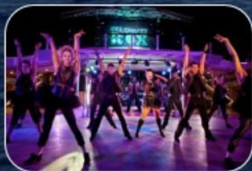
РАЗВЛЕКАТЕЛЬНАЯ ПРОГРАММА НА БОРТУ