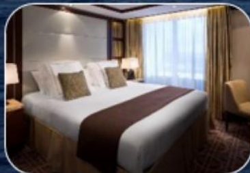
СТАНДАРТНЫЕ НОМЕРА КАК В ЛЮКС-ОТЕЛЯХ