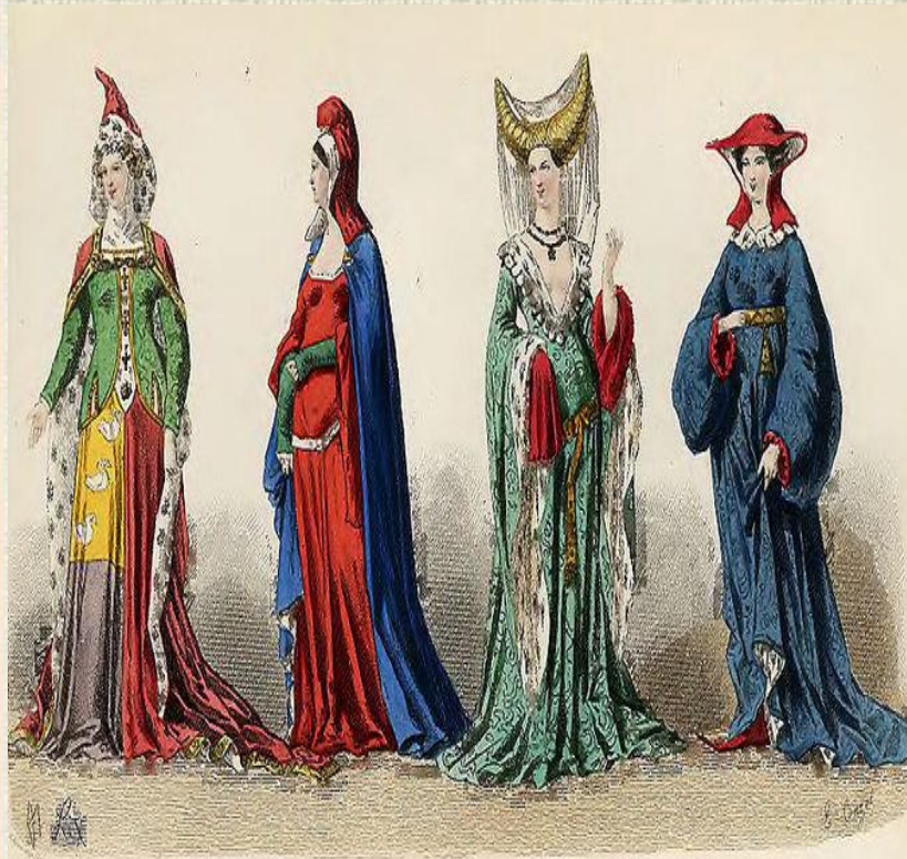
Charles V 1564 to 1588