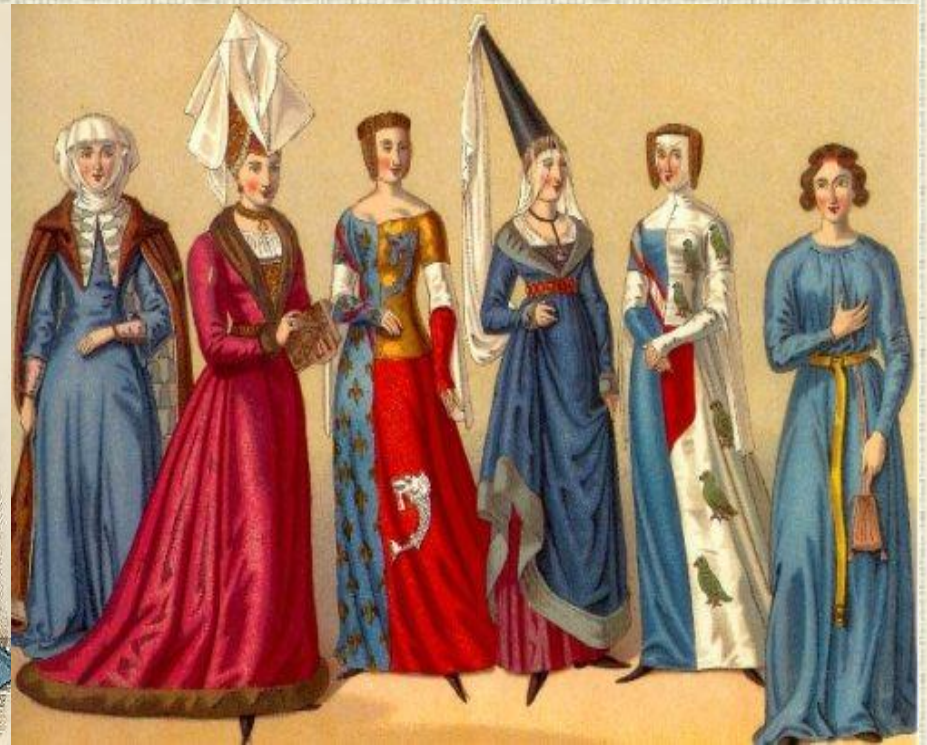
Charles VI 1580 to 1595